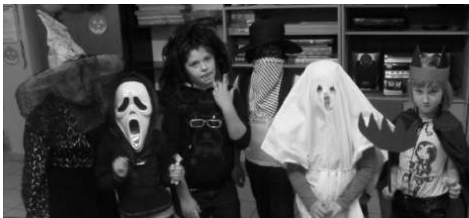
Dzieci dumnie prezentuj swoje przebrania