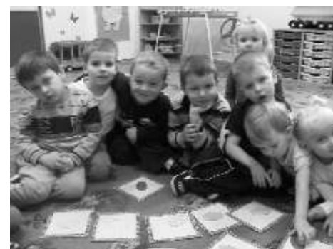
Dzieci z zaang owaniem uczestniczyły w zaj ciach

Celem programu matematyki sensorycznej jest co wa niejszego ni tylko nauczenie dzieci przypisywania przedmiotom cech - to jest czerwone, to jest trójk tne, a to jest du e. Zadania praktyczne zach caj dzieci do analizowania znaczenia tego, e co jest czerwone, e jaki przedmiot jest trójk tny. Skupiaj si na tym w jaki sposób mo na rozró ni kolory lub kształty, sk d wiadomo e jaka rzecz jest wi ksza od drugiej, a mniejsza od trzeciej.