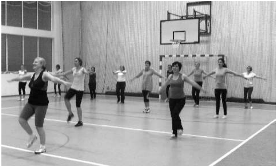
Zaj cia z aeurobiku cies z si ogromnym zainteresowaniem