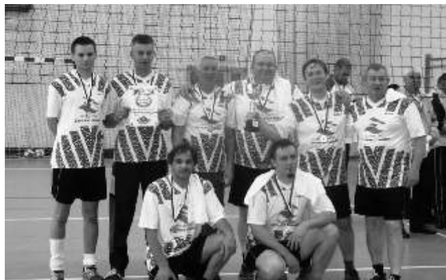
Reprezentacja Urz du Gminy w Lisewie

Cały turniej był bardzo dobrze zorganizowany. Na wszystkich uczestników turnieju czekała