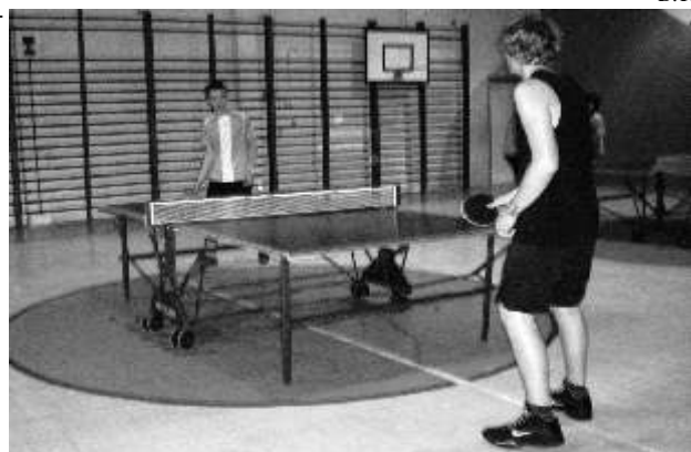
Młodzież walczy o trofeum