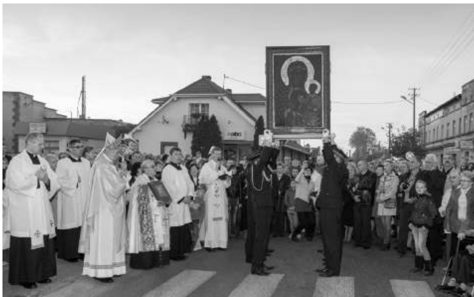
Uroczyste powitanie obrazu w Lisewie

Na uznanie zasługuje postawa jak zaprezentowali motocykliści z Lisewa, którzy sami utworzyli specjalną eskortę dla tego obrazu towarzysząc mu aż do miejsca uroczystego powitania.