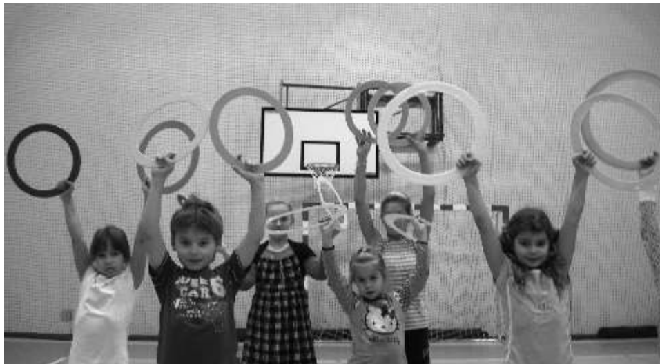
Nawet najmłodzi korzystaj z obiektu