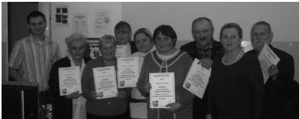
Kursanci po skończonych naukach ze swoim wykładowcą