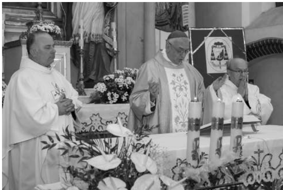
Msza wiwatowa prowadzona przez ks. Biskupa