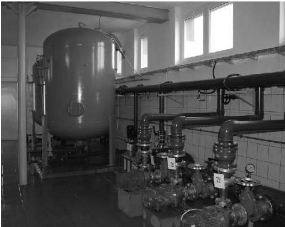
Stacja uzdatniania wody w Kamlarkach została wyposażona w nowoczesny sprzęt

Na sieci kanalizacyjnej wymagają remontu dwie (z 5-ciu wymienionych) przepompownie cieków. Wymaga zwiększonego zakresu robót konserwacyjnych gminna oczyszczalnia. Na sieci wodociągowej mamy do wymiany szereg zasuw, hydrantów i przyłączy do domostw.