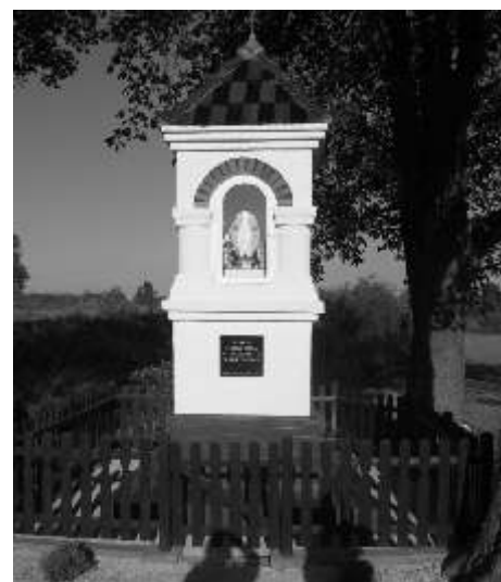
Piękna kapliczka z wizerunkiem Matki Boskiej