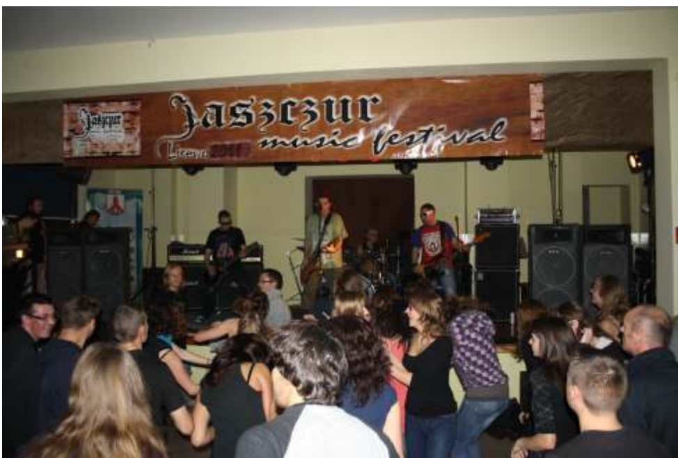
Publiczno wietnie si bawiła podczas koncertu