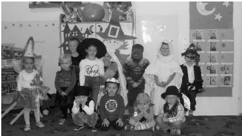
Dzieci w swoich przebraniach