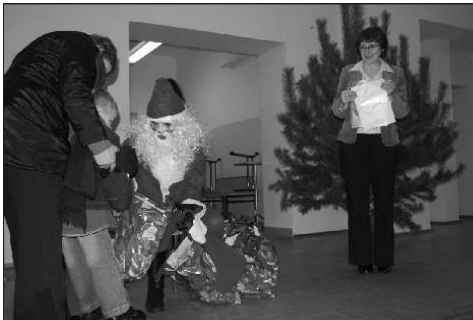
Gwiazdor wręcza paczki