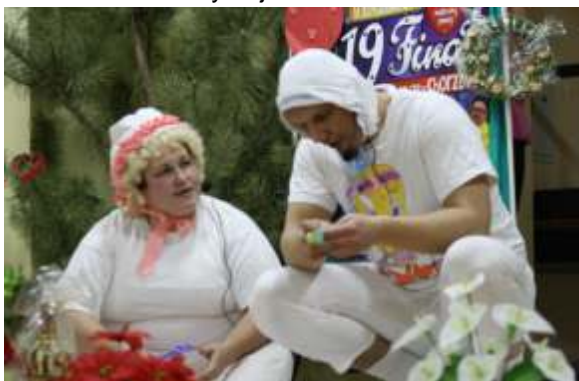
Kabaret "NIE WIEM"- DPS Mgoszcz