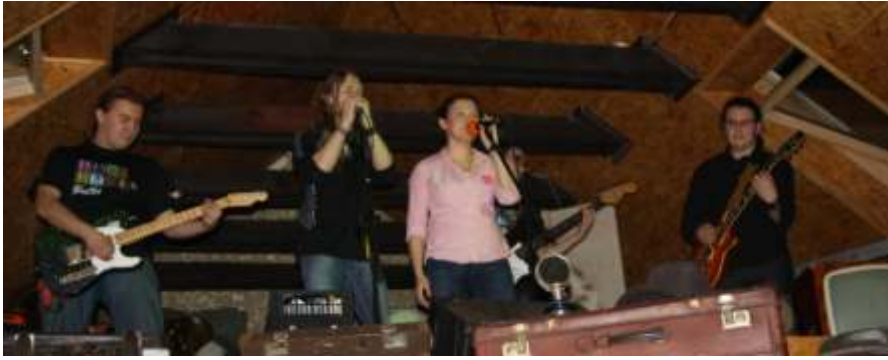
"Zespół GOODWAY" - Outsajder - bar Drzonówko