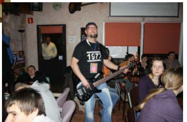
Outsajder - bar Drzonówko