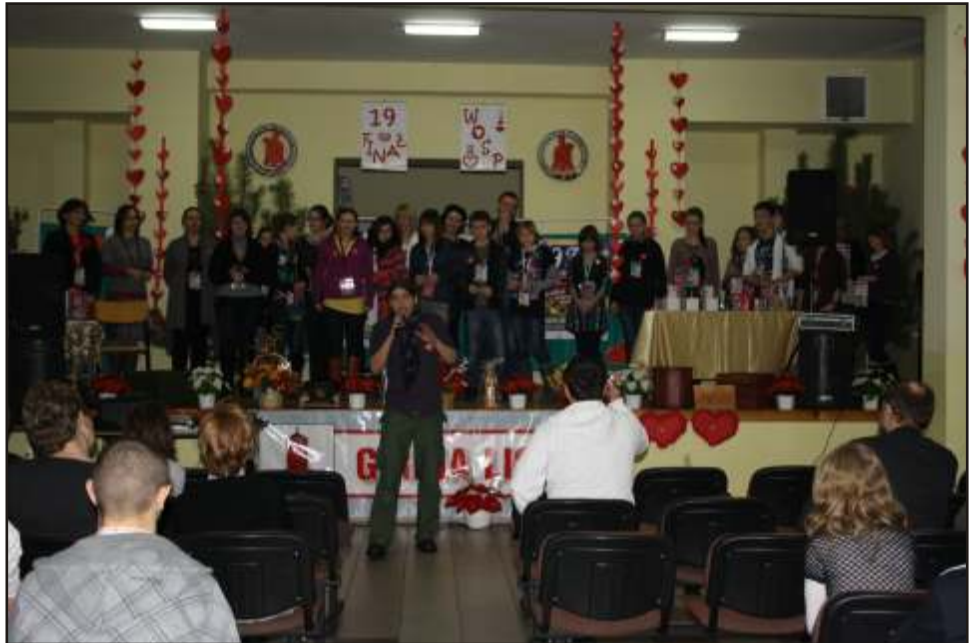
Sztab Wielkiej Orkiestry witecznej Pomocy

W tym roku WO P grała dla dzieci z chorobami urologicznymi. Dnia 9.01.2011 roku nasi mieszkańcy po raz kolejny mogli wesprzeć Fundację Jurka Owsaka. Imprezy rozpoczęły się już w godzinach przedpołudniowych rozgrywkami piłki halowej. Młodszy sportowcy i kibice mogli już liczyć na wsparcie WO P. O godz. 16.00 w sali widowiskowej rozpoczęły się koncerty i licytacje. Na scenie popisywała się młodzież ZSO Lisewo i kabaret DPS Mgoszcz. W sali sesyjnej działała kawiarenka, gdzie za datkę do puszek można było zjeść pyszne ciasto i napić się kawy lub herbaty. Na sali był też orkiestrowy kram. W „19 Finale” uczestniczyło 35 wolontariuszy. Kwestowała młodzież z naszej gminy, nauczyciele i uczniowie ZSO Lisewo, pracownicy DPS Mgoszcz, pracownicy Gminnej Biblioteki Publicznej w Lisewie, sołtys Lisewa oraz załoga „Autsajder - baru” z Drzonówka, gdzie Lisewska Orkiestra przeniosła się ok. godz. 20.00. Tam odbywały się licytacje oraz mogliśmy