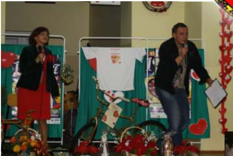
Licytacja w Lisewie