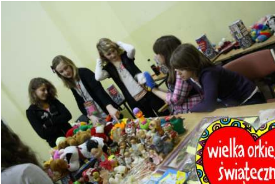
"Wielkoorkiestrowy" kram i wolontariuszki