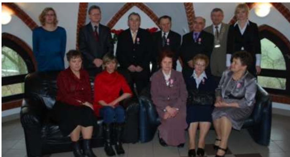
Solenizanci wraz z zaproszonymi gośćmi, Wójtem Gminy oraz pracownikami urzędu

Wójt Gminy podziękował jubilatów za trud pracy i wyrzeczenia dla dobra swoich rodzin za minionych pół wieku temu. Spotkanie odbyło się w sympatycznej atmosferze. >>> 2