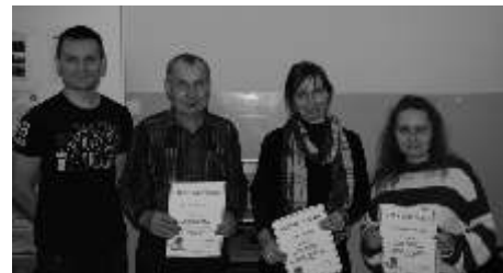
Uczestnicy dumnie prezentuj swoje za wiadczenia