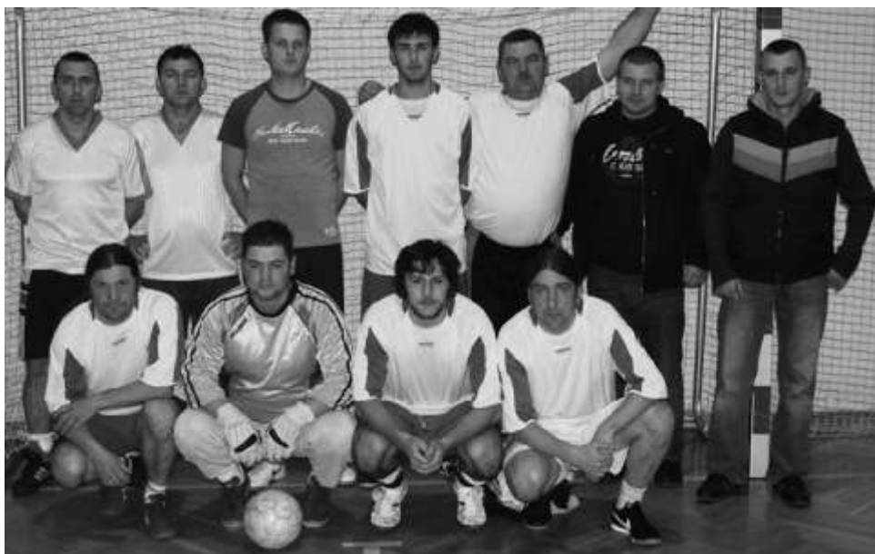
Zwycięska drużyna - Old Boys