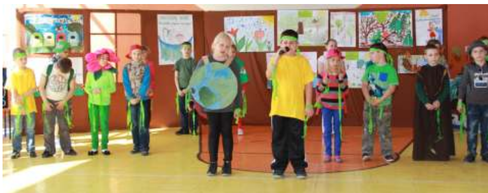
Wyst p uczniów klasy Va