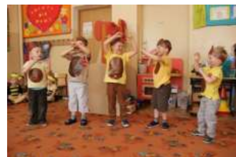
Chłopcy jako niedwiadki