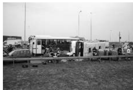
Wszystko wyglądało bardzo realistycznie

To pierwsze wiczenia okolicznych służb i strażnic na tak wielką skalę. Państwowa Straż Pożarna, która była organizatorem przedsięwzięcia zadbała, aby wypadek wyglądał tak realistycznie, jakby zdarzył się naprawdę. Stąd też zdziwienie i strach wielu kierowców przejeżdżających autostradą w tym czasie. W katastrofie brała udział grupa