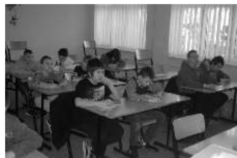
Uczniowie podczas zmagania