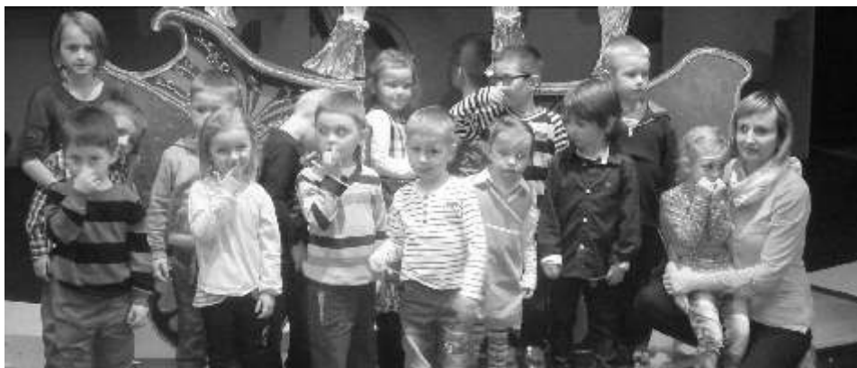
Dzieci były bardzo zadowolone z wizyty w teatrze