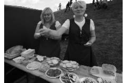
Panie czystowały chlebem ze smalcem i nie tylko

z grilla surówkami, kluski ziemniaczane z kapustą, chleb ze smalcem i ogórkiem kiszonym, a także kawa, herbata i ciasto. Niespodzianką Majówki była obecność przybyłych na koniach przedstawicieli Chełmińskiego Bractwa Kurkowego. Zaprezentowali historię Bractwa oraz uatrakcyjnili imprezę przejeżdżając kamiennymi dla najmłodszych.