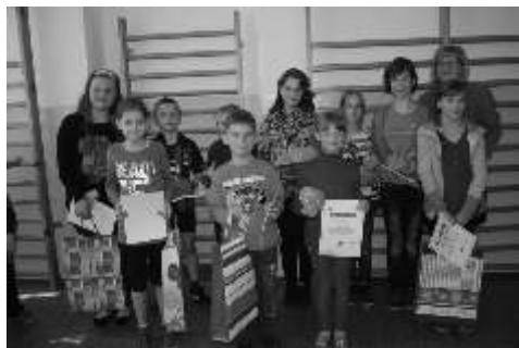
Wspólne zdjęcie laureatów