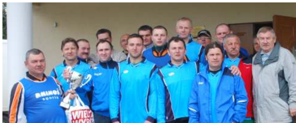
Drużyna OLD Boys - zwycięzca turnieju wraz z p. Wójtem