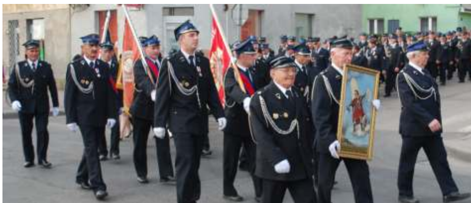
Uroczysty przemarsz braci strackiej do ko ciola