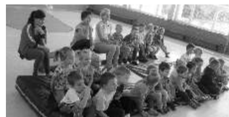
Maluchy z ciekawością oglądały spektakl

Miesiąc później do naszego przedszkola przyjechał Teatr Lalek „Zaczarowany wiatr” z przedstawieniem pt. „Ja i Małgosia”.