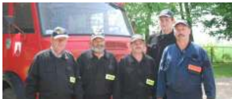
Jedna z przybyłych jednostek - OSP Mgoszcz

Poszkodowanym udzielano natychmiastowej pomocy w wydzielonym miejscu. Cała akcja, ł cznie z oczekiwaniem na przyjazd stra aków, trwała kilkadziesi t minut.