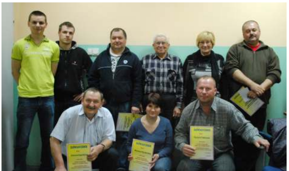
Kursanci ze swoim wykładowcą