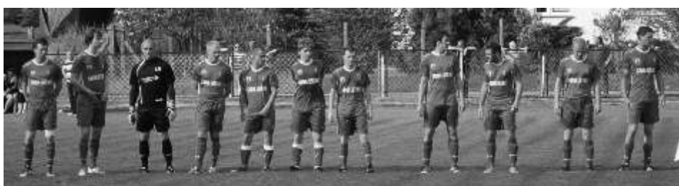
Piłkarze lisewskiej drużyny podczas jednego z meczów