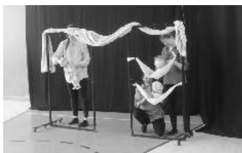
Teatr Lalek „Zaczarowany wiatr”