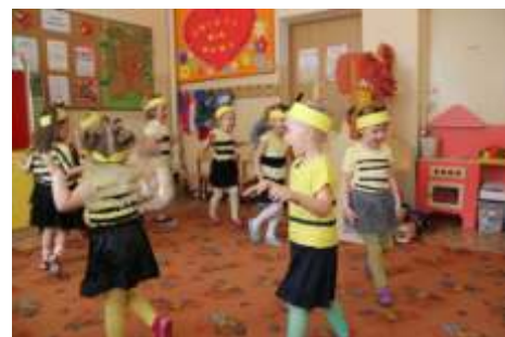
Dziewczynki w strojach pszczołek