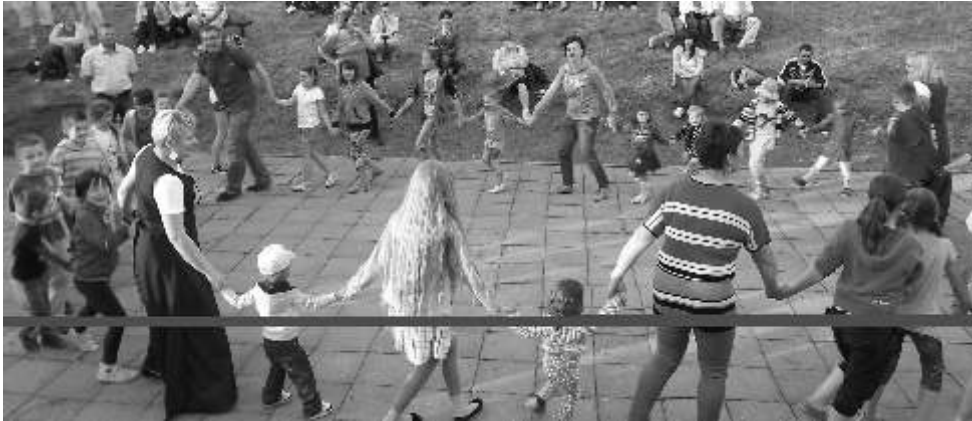
Przybyli go cie z ch ci uczestniczyli w zabawach

Dnia 18 maja 2013 r. na Górze Zamkowej w Starogrodzie odbyła się Majówka z LGD poświęcona z Biesiad Starogrodzkich. To już IV tego typu impreza promocyjno - kulturalna zorganizowana wspólnie przez Stowarzyszenie Lokalna Grupa Działania - „Vistula-Terra Culmensis” oraz sołectwo Starogród.