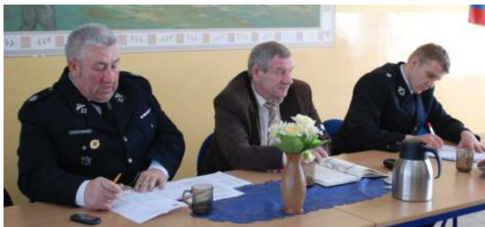
Prezydium Oddziału Gminnego Związku OSPRP w Lisewie