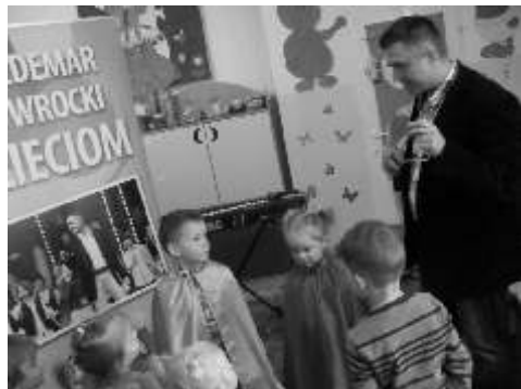
Dzieci z chęcią brały udział w zajęciach