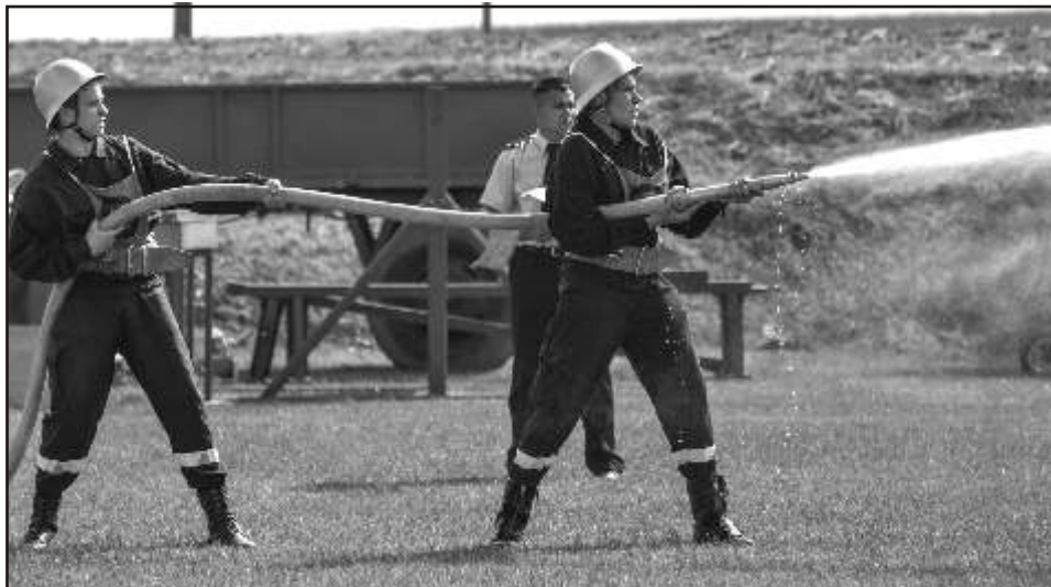
Druhowie z OSP Lisewo w trakcie konkurencji bojowej