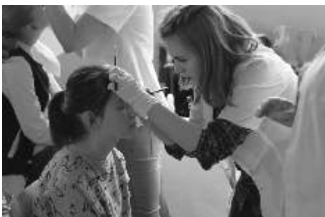
Podczas pikniku nauczyciele ze szkoły Cosinus wykonywali makijaż

dietetyka, który odwiedził naszą szkołę. W sali biologicznej wywieszono zostały plakaty i informacje dotyczące uprawy bezpiecznych owoców i warzyw - wykorzystane ze strony internetowej wiatowej Organizacji Zdrowia. Uczniowie na lekcjach oraz rodzice w ramach Pikniku