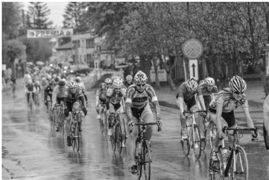
Przejazd przez ul. Chełmińską w Lisewie

W Lisewie na ul. Chełmińskiej o godz. 15:00 odbył się start wyścigu juniorów, którego trasa przebiegała przez teren naszej gminy oraz sąsiedniej gminy Płunickiej. Odbyły się 4 rundy takiego przejazdu - łącznie 90 km, zakończone metem na stadionie w Płunicy. Wyścig juniorów poprzedzony