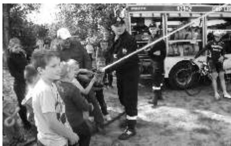
Niezwykła atrakcja dla dzieci były pokazy strackie

W Pniewitem przy w malowniczej scenerii boiska i placu zabaw wiotowano potrójne wiot: Dzie Matki, Dziecka i Ojca. Spotkanie rozpoczęło si od złożenia życzeń rodzicom i ich dzieciom. W trakcie festynu maluchy chętnie uczestniczyły w ró nych zabawach, grach i konkursach. Na twarzach uczestników mo na było zauważyć ogromne zadowolenie. Podczas imprezy ka dy mógł skosztować kiełbask z ogniska oraz inne smakołyki i napoje, które zostały zakupione ze środków Gminnej Komisji Rozwoju żywienia Problemów Alkoholowych. Wielką niespodzianką zrobiła nam również ona Pana sołtysa, która dostarczyła nam wiele słodkości. To popołudnie upłyn ł nam w bardzo miłej atmosferze.