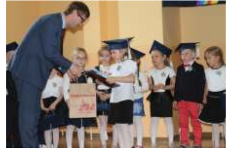
Dla najlepszych przygotowano nagrody

W ramach obchodów Jubileuszowych, w Przedszkolu odbył się konkurs plastyczny na odwzorowanie herbu Lisewa. Spośród zgłoszonych do konkursu prac, pierwsze trzy nagrody zdobyły: