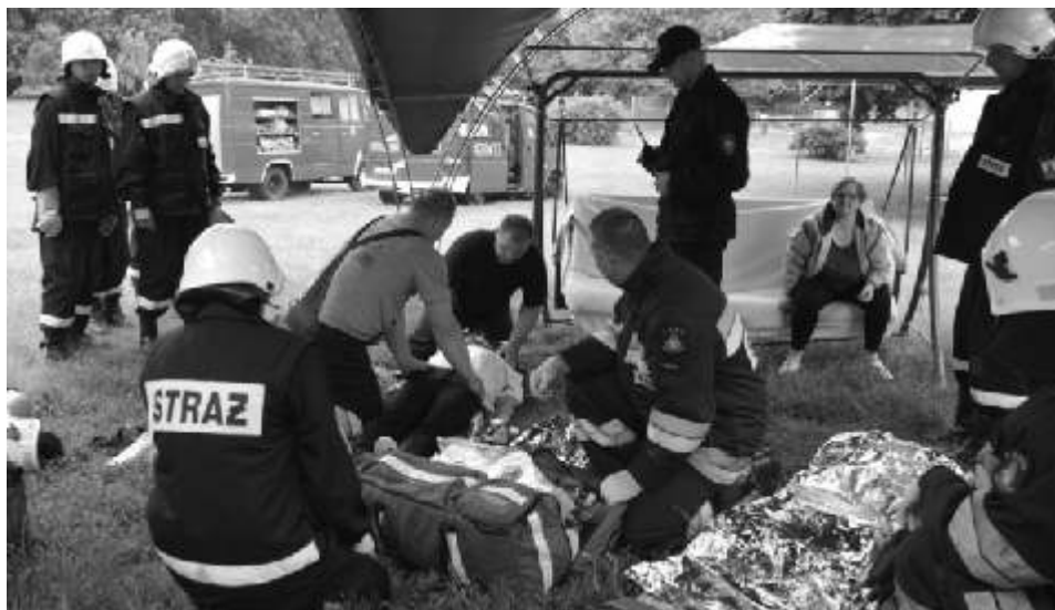
Udzielania pierwszej pomocy poszkodowanym

Na terenie Zakładu Produkcyjnego "Adriana" SA odbyło się wiczenie obronne pod kryptonimem Kobra 2015. Jego celem było przygotowanie do współdziałania organów kierowania szczebla gminnego z jednostkami organizacyjnymi i siłami systemu ratowniczego na wypadek zamachu