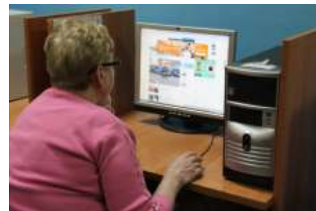
Kursanci w trakcie szkolenia byli bardzo skupieni

W Gminnym Centrum Informacji odbył się bezpłatny kurs podstaw obsługi komputera. Program kursu obejmował trzy działy: zapoznanie z zestawem komputerowym, wprowadzenie do systemu Windows; praca z edytorem tekstu MS Word oraz poruszanie się w Internecie. Po części teoretycznej nastąpiła część praktyczna, w której uczestnicy wykonywali zadania oraz ćwiczenia.