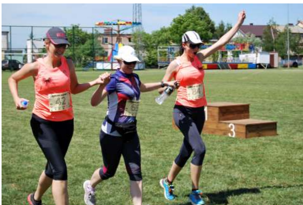
Wspólnymi siłami zawodniczki wkroczyły na metę