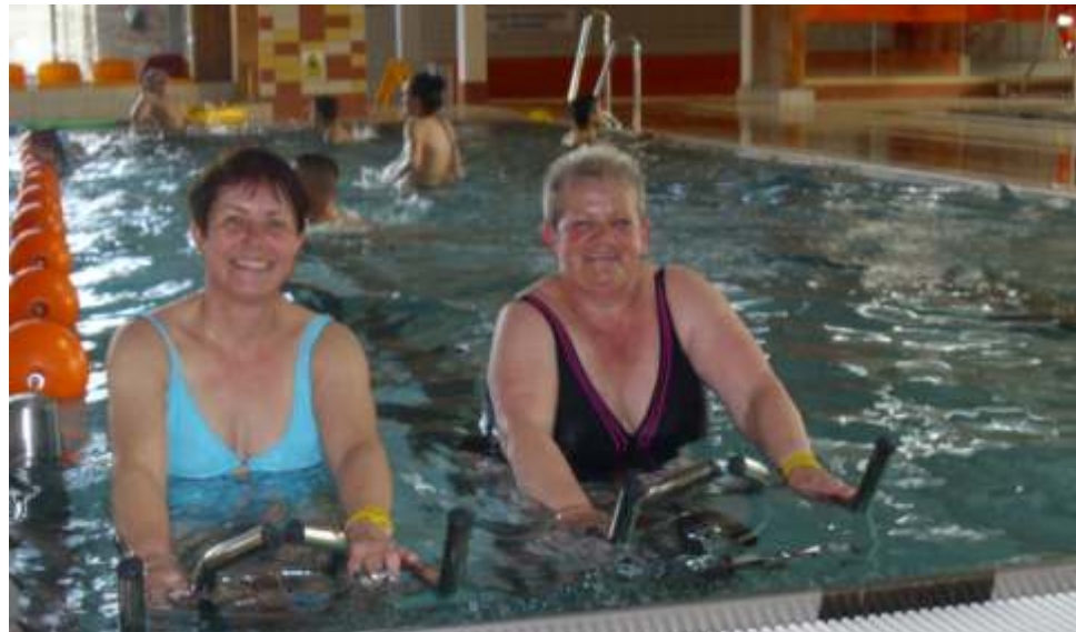
Na basenie ka dy znalazł co dla siebie

i dorosłych. Na basenie korzystali my z wielk przyjemno ci ze zje d alni wodnych, k piel i sauny. Wszystkim sprawiło to wielk rado . Taki wypad to znakomita okazja aby pokaza , i w wolnym czasie mo na aktywnie dba o zdrowie.