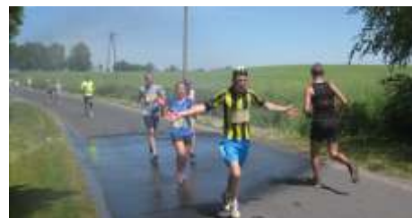
Kurtyna wodna - Lipienek