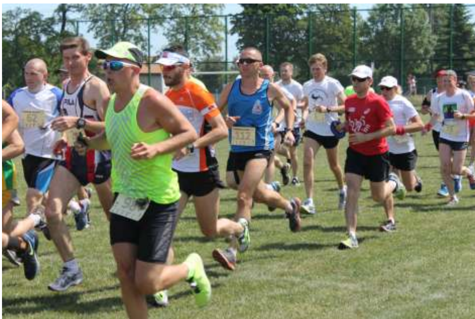
Zawodnicy podczas startu biegu