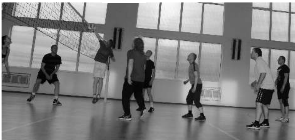
Zajęcia na sali sportowej w Krusinie