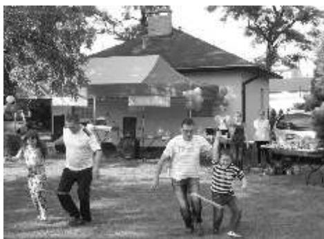
Wszyscy uczestnicy biesiady wietnie si bawili

W niedzielę, 28 czerwca w "Ogródku Jordanowskim" odbył się piknik dla mieszkańców Lisewa, w trakcie spotkania na przybyłych czekały liczne konkursy plastyczne, sportowo - sprawnościowe, wokalne i zręcznościowe. Uczestnicy zostali nagrodzeni upominkami oraz skorzystali z poczęstunku: słodyczkami, napojami, a także kiełbaski upieczonej nad ogniskiem. W trakcie biesiady wystąpił lokalny ludowy zespół "Lisewianie".