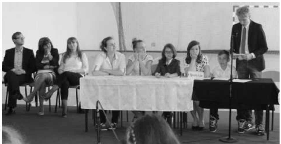
Debata oxfordzka w Krusinie