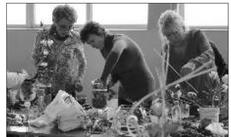
Pokaz dekoracji stołu komunijnego