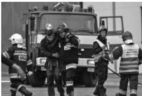
Druhowie podczas jednej z akcji

terrorystycznego. Brało w nim udział kilkanaście zastępów jednostek ochrony przeciwpożarowej z powiatu chełmskiego (w tym OSP, PSP i Zakładowa Straż Pożarna). Z terenu Gminy Lisewo w wiczenia zaangażowane były dwa samochody bojowe wraz z obsadami z OSP Lisewo (należące do Krajowego Systemu Ratowniczo-Gaśniczego) oraz OSP Lipienek. W wiczeniu uczestniczyły też siły ratownicze powiatu m.in.: Komenda