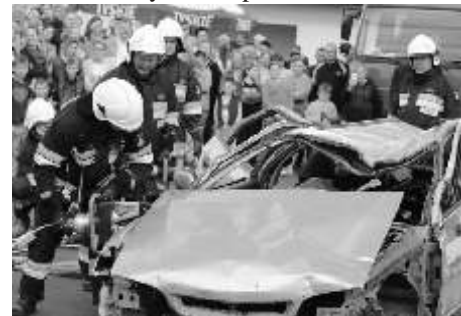
Pokaz rozcinańcia wraku samochodu

chcący mogli obejrzeć sprzątki policyjne, strażackie i medyczne. W trakcie festynu odbył się również "I Gminny, Młodzieżowy Bieg Jaszczurczy", w którym uczestniczyli dzieci ze szkół podstawowych i gimnazjum z terenu gminy Lisewo. Gminna Komisja Rozwiązywania Problemów Alkoholowych w Lisewie przygotowała kampanię pod nazwą "Przeciw pijanym kierowcom" chcąc przybliżyć ten problem mieszkańcom gminy. Na stoisku przygotowano i rozdano wiele ulotek, mówiących o przyczynach i skutkach picia alkoholu. W trakcie trwania festynu uczestnicy mogli zjeść kiełbaski z grilla, chleb ze smalcem a także skosztować wypieków i napić się kawy przygotowanej przez Panią z „Peretek”, a dla dzieci były przygotowane pyszne drożdżówki z Piekarni "Jarz b". Wieczorem wystąpił coverowy zespół "CORAL"