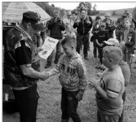
Na wszystkich czekały nagrody