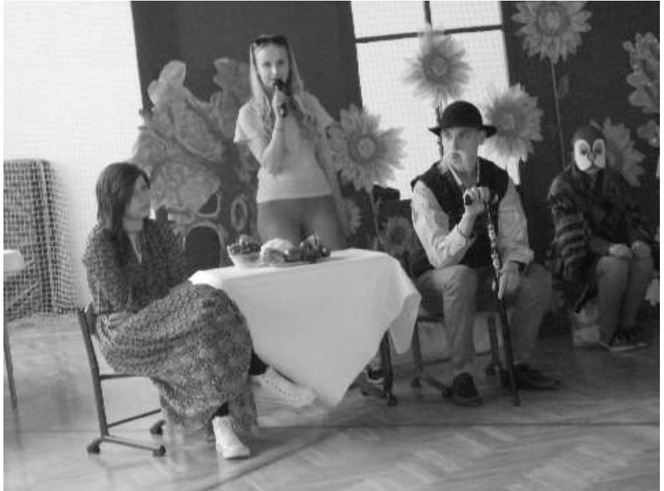
Grupa młodzieży przedstawia spektakl, pt.: „Ziemia - jej los, jest naszym losem”