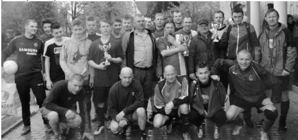
Pamiątkowe zdjęcie uczestników turnieju