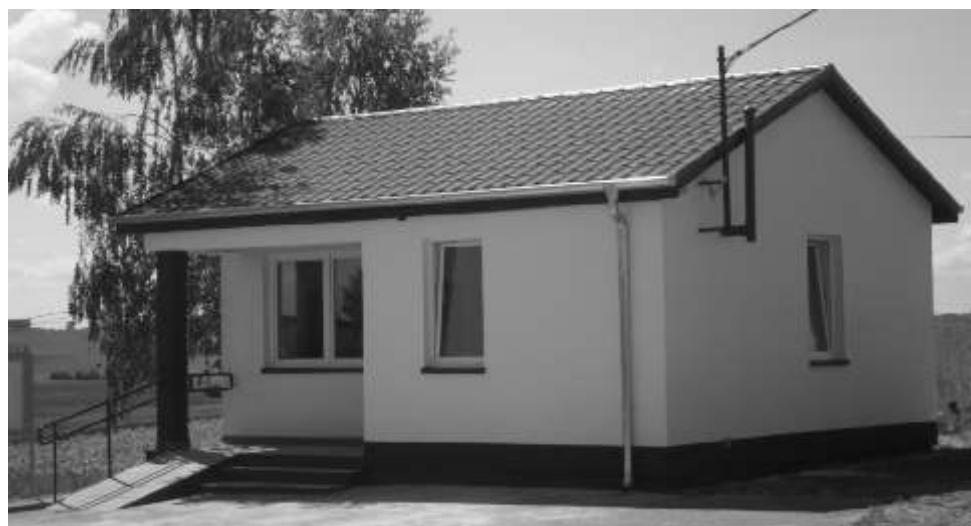
Nowa wietlica w Chrustach po metamorfozie

Dziękujemy wszystkim tym mieszkańcom wsi Chrusty, którzy zdecydowanie interesowali się postępowaniem prac, słuchali dobrych rad, ale i tym, którzy udostępnili swoje pomieszczenia i przechowali na czas