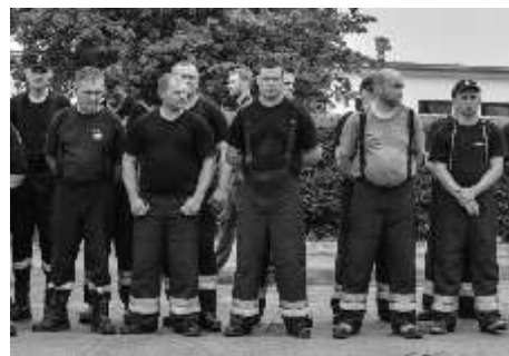
Strażacy po wiczeniach byli wyczerpani

Powiatowa Policja w Chełmnie, Komenda Powiatowa Państwowej Straży Pożarnej w Chełmnie, Pogotowie Ratunkowe. Przybyli na miejsce wójtowie gmin powiatu chełmskiego, Burmistrz Miasta Chełmna oraz Starosta Chełmski wraz z pracownikami merytorycznymi obserwowali działania prowadzone na terenie "Adriana". Podsumowania wiczenia