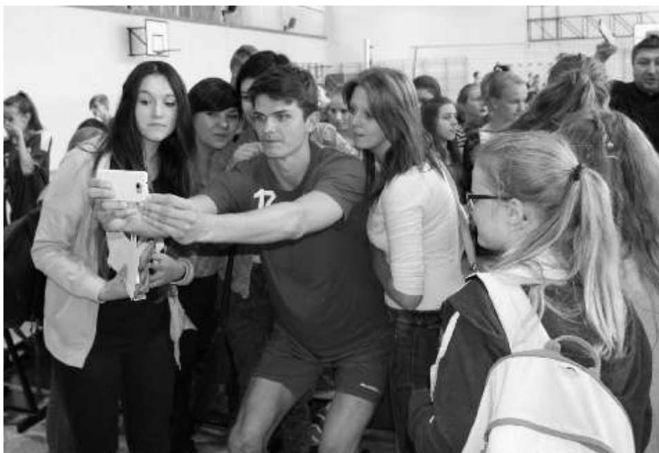
Zawodnicy chętnie pozwolili do wspólnych zdjęć

Na spotkanie w Lisewie zjawili się zawodnicy wraz ze sztabem szkoleniowym.