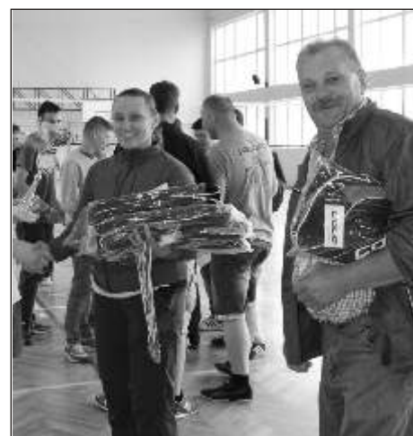
Zawodnicy zwycięskiej drużyny pierwszego turnieju - "Kropelka" Lisewo