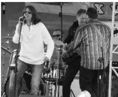
Występ gwiazdy wieczoru zespołu "CORAL"