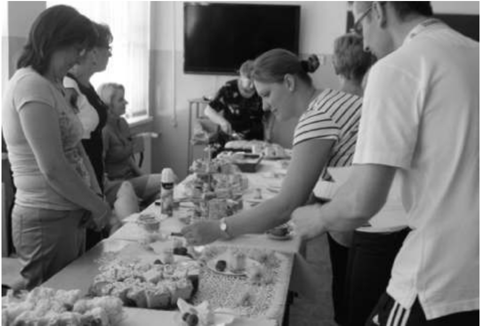
Jury miało bardzo trudne zadanie by wyłonić najlepsze wypieki