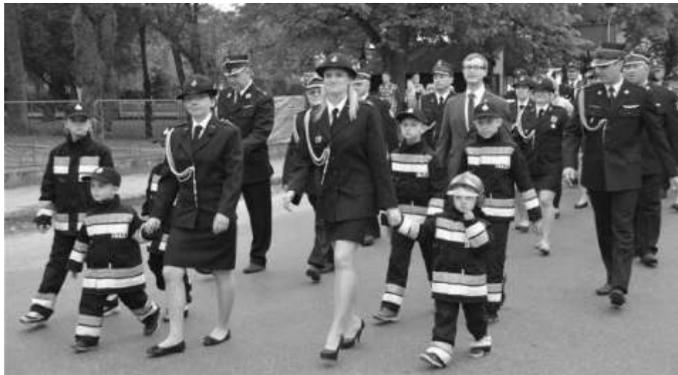
Uroczysty przemarsz ulicami Lisewa

Wszystkim strażakom z okazji ich wyjazdów na bezpiecznych powrotach z akcji oraz szczerze wyciągniętych i zawodowym. Całkowicie uroczystość w wietnił przemarsz ulicami Lisewa strażaków, pocztów sztandarowych, a także przejazd wozów strażackich w towarzystwie Orkiestry Dętej oraz mazurek z Chełmińskiego Domu Kultury. Pogoda dopisała i mieszkańcy do późnych godzin nocnych wietnie bawili się na zabawie tanecznej i przy ognisku.