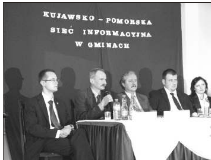
Stowarzyszenie było już kilkakrotnie organizatorem konferencji i spotkań, na zdjęciach konferencja: KPSI w Gminach.