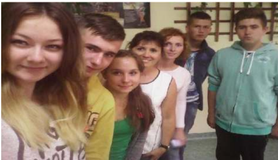
Członkowie Młodzieżowej Rady Gminy Lisewo wraz z opiekunką