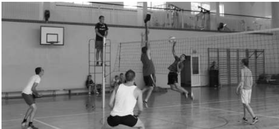
Siatkarze toczyli walkę do końca turnieju

Z biegiem czasu pogoda stała się łaskawsza, dzięki czemu możliwe było przeprowadzenie na wiejskim powietrzu Gminnego Dnia Sportu. Miejscem imprezy było boisko wielofunkcyjne przy Szkole Podstawowej w Lisewie. Na wszystkich przybyłych czekał szereg atrakcji: konkurs plastyczny, malowanie twarzy, wiele konkurencji, gier i zabaw sportowych oraz zajęcia cyrkowe poprowadzonych przez grupę "Circolo" działającą przy Szkole Podstawowej w Krusinie. Dla każdego uczestnika przygotowano drobne upominki oraz słodycze. Był to wspaniały sposób na aktywne spędzenie wolnego czasu.