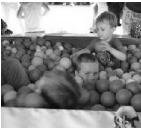
Maluchy także znalazły coś dla siebie

W sobotę, 27 czerwca do Mieszkańców Domu Pomocy Społecznej w Mgoszczu zjechały tłumy gości. Już po raz piąty odbył się tu bowiem Zjazd Rodzin. Przygotowania do tego wydarzenia w Mieszkańcu imprezy trwały już od kilku tygodni. Na tym wyjątkowym okazji zorganizowano szereg atrakcji. Najmłodsi goście mogli korzystać z wydzielonego placu zabaw, dorośli sprawdzali swoje umiejętności na strzelnicy. Na wszystkich czekały przejeżdżające konnym oraz loteria fantowa. Tradycyjnie Zespół "Stokrotki", którego członkami są mieszkańcy DPS w Mgoszczu przygotował przedstawienie. Tym razem była to "Pielgrzymka Królowa 2015". To jednak nie wszystko co działo się tego dnia w Mgoszczu. O godzinie 14.00 rozpoczął się bowiem XV Piknik Integracyjny. Można powiedzieć, że Piknik na stałe wpisał się w harmonogram lokalnych, letnich imprez. Od kilku lat stałym punktem Pikniku są stoiska holenderskie, gdzie wolontariusze zapraszają nie tylko Stowarzyszenia Zeeland Helpt Polen serwując przysmaki tamtejszej kuchni. W tym roku poza "frykadkami"