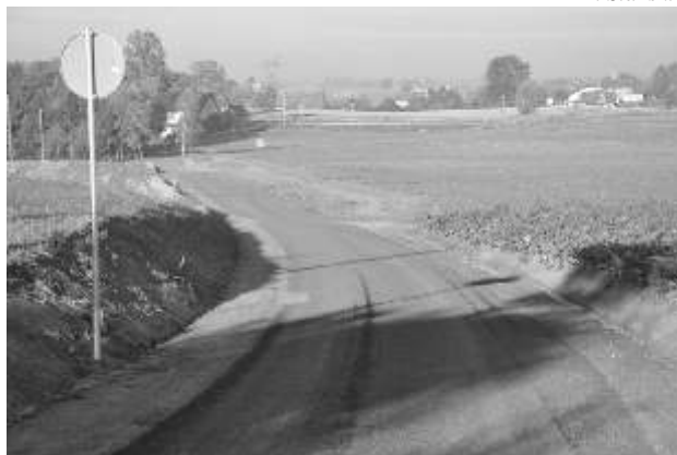
Odcinek przebudowanej drogi Malankowo - Pniewite