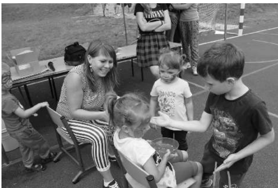
"Kto ma więcej pięt" - jedna z zabaw, w których brał udział dzieci przybyłe na Gminny Dzień Sportu