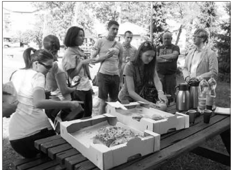
Nasi go cie mogli skosztowa pysznych dro dówek

Nast pne zaprezentowali my naszym go ciom działalno rodzinnej firmy J.A.W. Ł cz ze wiecia nad Osa, która m.in.