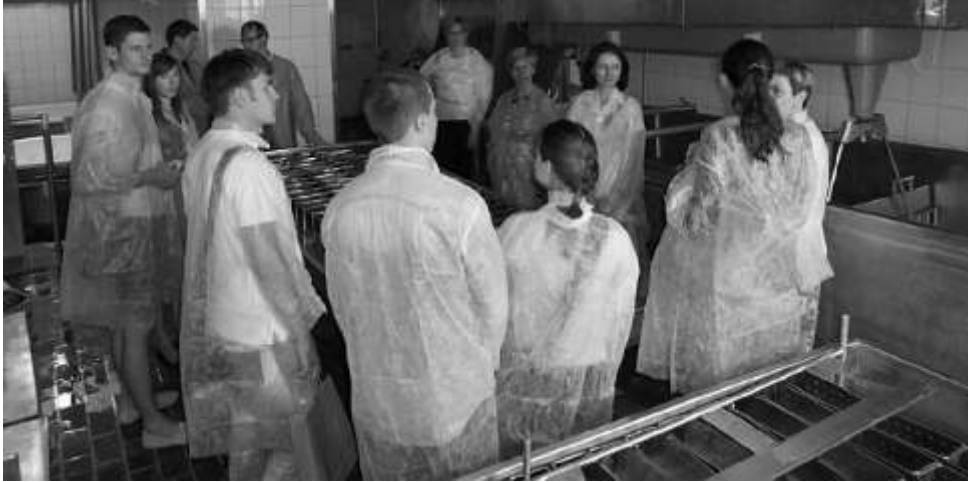
Przybyli go cie odwiedzili te mleczarni w Lisewie

W trakcie wizyty nasi go cie mieli mo liwo spotkania si z wójtami gminy Chełmno, Stolno i Lisewo, którzy opowiedzieli o działaniu swoich jednostek. Nast pnego dnia wspólnie uczestniczyli my w Festiwalu Smaku w Grucznie podczas, którego mo na było spróbowa i zakupi przywiezione przez Mołdawian produkty, w s z c z e g ó l n o c i d e m z płatków ró y i wódki morelowej.