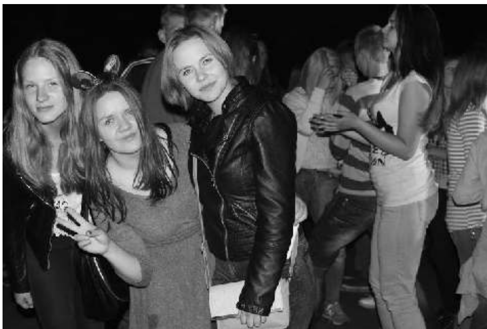
Wszyscy przybyli na "Summer Revolution" wietnie bawili się podczas imprezy