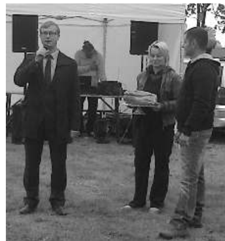
Na samym początku Pan Wójt wraz z Panią sołtys przywitał wszystkich gości