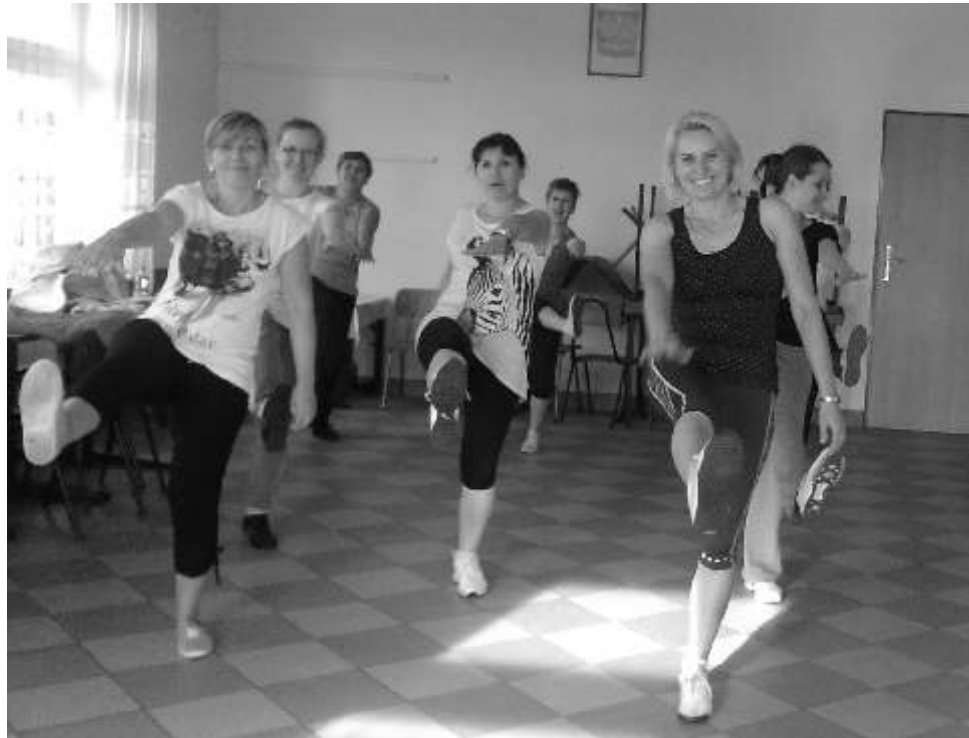
Wspólne wiczenia aerobikowe sprawiły Paniom du o rado ci

wrze nia. Głównym celem projektu było zaktywizowanie i zainspirowanie kobiet nie tylko z Malankowa ale tak e z pobliskich miejscowoci do podjcia działa na rzecz swojego własnego rozwoju poprzez udział w zaj ciach dopasowanych do ich zainteresowa. Projekt odpowiadał na