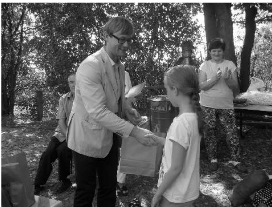
Pan wójt wręcza nagrody dzieciom za udział w konkursie plastycznym "Przeciw pijanym kierowcom"