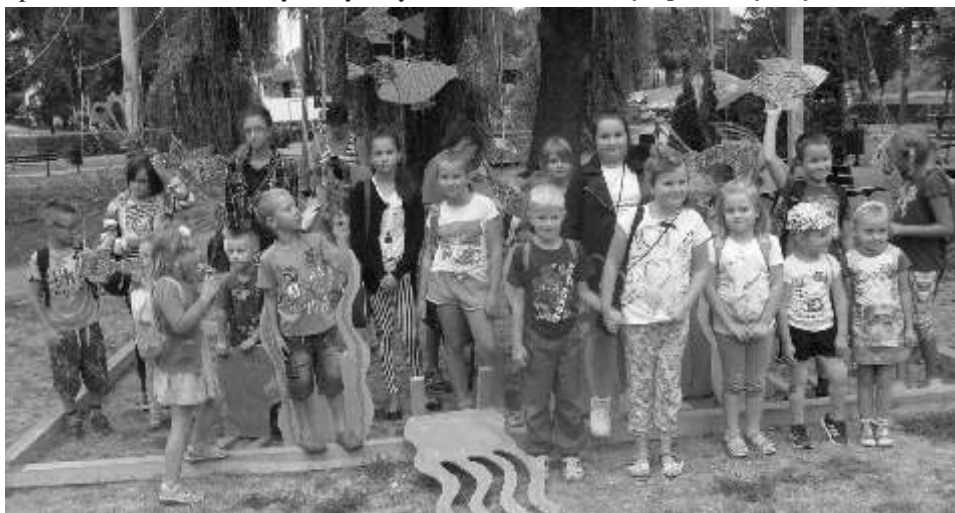
Koniec wakacji dzieci spędziły w kinie "Wrzos" w wietlicy

w Pniewie i w Drzonowie wybraliśmy się do kina Wrzos w wietlicy na film animowany pt. "Bystry Bill". Po