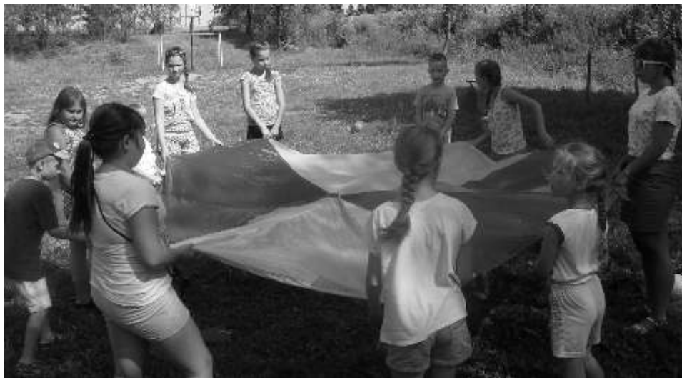
Dzieci chętnie brały udział w różnych grach i zabawach

dział. Reasumując nasze przedsięwzięcia widać, że wakacje spędziliśmy bardzo aktywnie. Kto skorzystał z naszych propozycji na pewno się nie nudził, zarówno starszy jak i młodszy. Pogoda nam dopisywała więc imprezy, które organizowaliśmy na wiecu powietrza