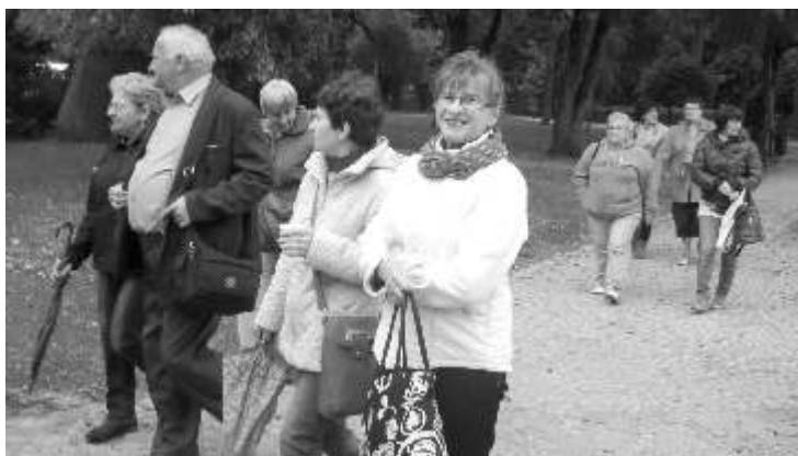
Wszyscy uczestnicy wyjazdu z zadowoleniem spacerowali po Ciechocinku

Z kolei 12 września, odbyła się wycieczka do Ciechocinka, tam pod kierownictwem Pani przewodniczki mogliśmy poznać historię najciekawszych