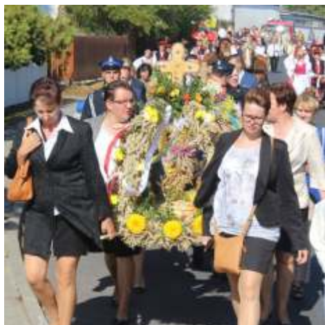
Tegoroczne wieniec dożynkowy był wyjątkowo piękny

Dużym zainteresowaniem widzów cieszył się „Turniej Sołectw z humorem”. Dla trzech najlepszych grup czekały nagrody w postaci bonów w wysokości 500, 400 i 300 zł, ponadto każda drużyna otrzymała skrzynkę piwa. Mieszkańcy Kornatowa, Chrusty, Pniewitego, Krajcina oraz Lipienka rywalizowali między sobą w rozmaitych konkurencjach. Zwycięstwo przypadło ekipie z Pniewitego, drugie miejsce zajęli zawodnicy z Chrusty, natomiast trzecie mieszkańcy Kornatowa. Cały turniej przebiegał w atmosferze przyjaznego