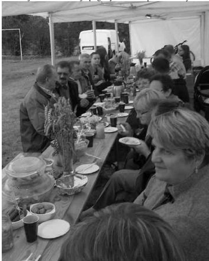
Biesiadnicy przy wspólnym poczęstunku

Dziękujemy wszystkim przybyłym gościom za zabawę i wspólnie spędzony czas.