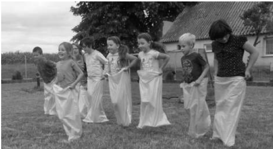
Dzieci z entuzjazmem brały udział w konkurencji "Skok w workach"

Takim, oto intrygującym tytułem opatrzyliśmy projekt wsi Chrusty i zgłosiliśmy go do otwartego konkursu ofert nr 2/2015 na wykonanie zadania publicznego w zakresie organizacji małych inicjatyw kulturalno - rekreacyjnych w 2015 r. na terenie gminy Lisewo. Projekt zakładał zwiększenie oferty edukacyjnej dla dzieci z sołectwa Chrusty w okresie od 01 - 06.2015 r. Zaplanowano w nim realizację zajęć ekologicznych w formie zabawy, oraz praktyczne nabywanie umiejętności dbania o środowisko. Uwieśnieniem całości stał się