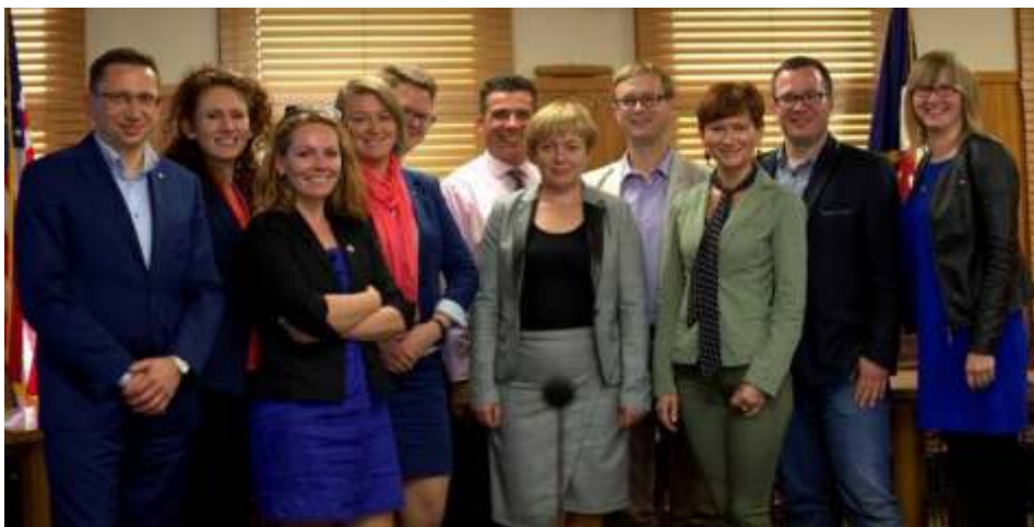
Grupa samorządowców podczas wizyty studyjnej w Stanach Zjednoczonych

młodzieży z terenu miasta, jak i 5 programów tematycznych dotyczących, m.in. samorządu - relacjonując ich posiedzenia komisji czy sesji, realizowane inwestycje oraz inicjatywy podejmowane przez mieszkańców. Trzech członków