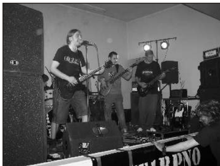
Zespół „Hounsis” z Chełmna