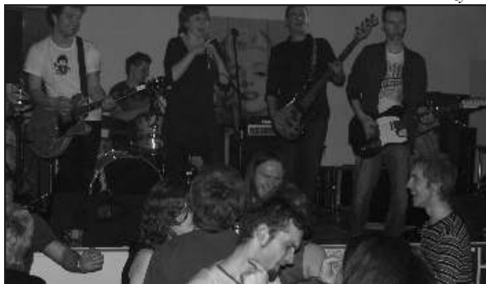
Zespół „The Lollipops” z Olsztyna