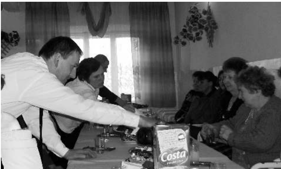
Panowie z chęcią obsługiwali solenizantki