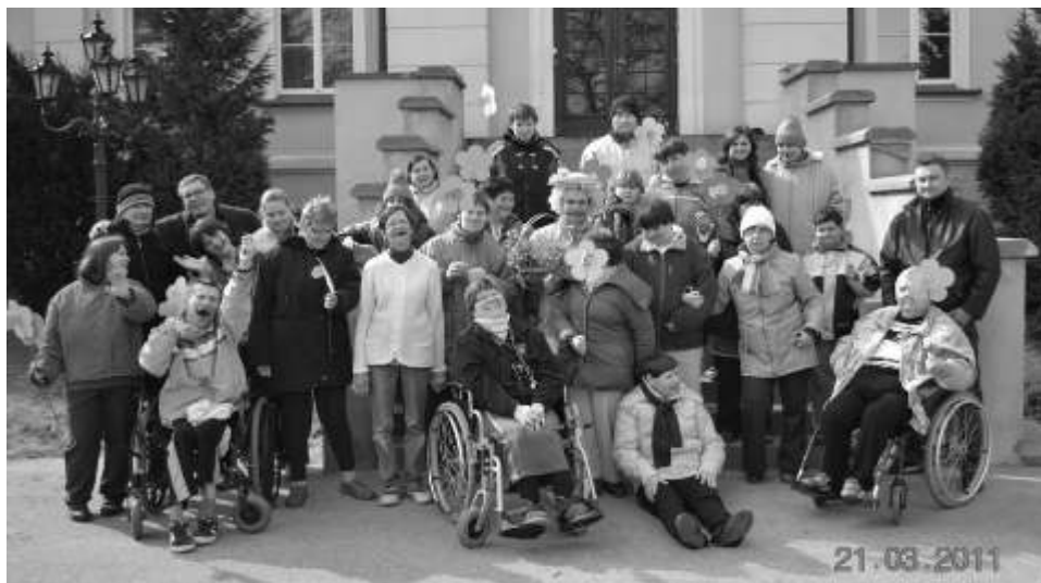
Uczestnicy poszukiwania wraz z opiekunami

z niemal satysfakcją. Tego roku była długa, nie na imię. Nie da się jednak ukryć, że również z uroków zimy chętnie korzystaliśmy, bo cóż może równać się z kuligiem i ekscytującą bitwą na niebieskie kulki. Ale co za duś, to niezdrowo, dlatego 21 marca Mieszkał w Domu Pomocy Społecznej w Mgoszczu wybrali się na powitanie wiosny z jednoczesnym poegnaniem zimy. Na ten dzień czekali od dłuższego czasu, więc kiedy wreszcie nadszedł, tłumnie ruszyli na poszukiwania Zielonej Pani. Pogoda była i ciepła, więc u niektórych nie brakowało. Tradycyjnie, musieliśmy się jednak odrobin