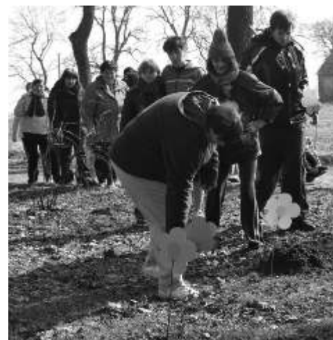
Kwiaty wskazywały poszukiwaczom drogę

cyfry i przypisać im litery. Układając je w prawidłowej kolejności poznaliśmy miejsce, w jakim ukryła się Słomiana Panna. Poradziliśmy sobie z tym zadaniem bezbłędnie, ale to nie był jeszcze koniec. „Marzanna” w końcu do nas przysłała. W miejscowym sklepie mieliśmy zakupić specjalny „zimowy oranżad”, ulubiony napój „Marzanny”. Dzięki jego specjalnej recepturze łatwiej było puścić słomianą kukłę z dymem. Mieszkał w naszym Domu należało do ludzi uczynnych, dlatego chętnie udaliśmy się do sklepu. Tam otrzymaliśmy wspomniany wcześniej trunek