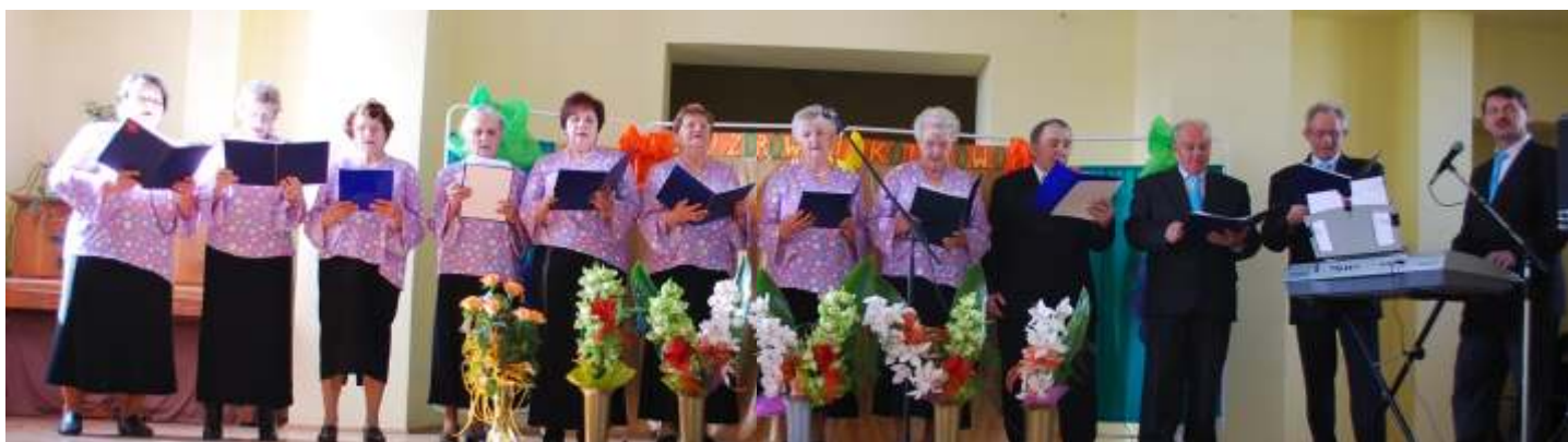
Zespół „Jak oni śpiewają”