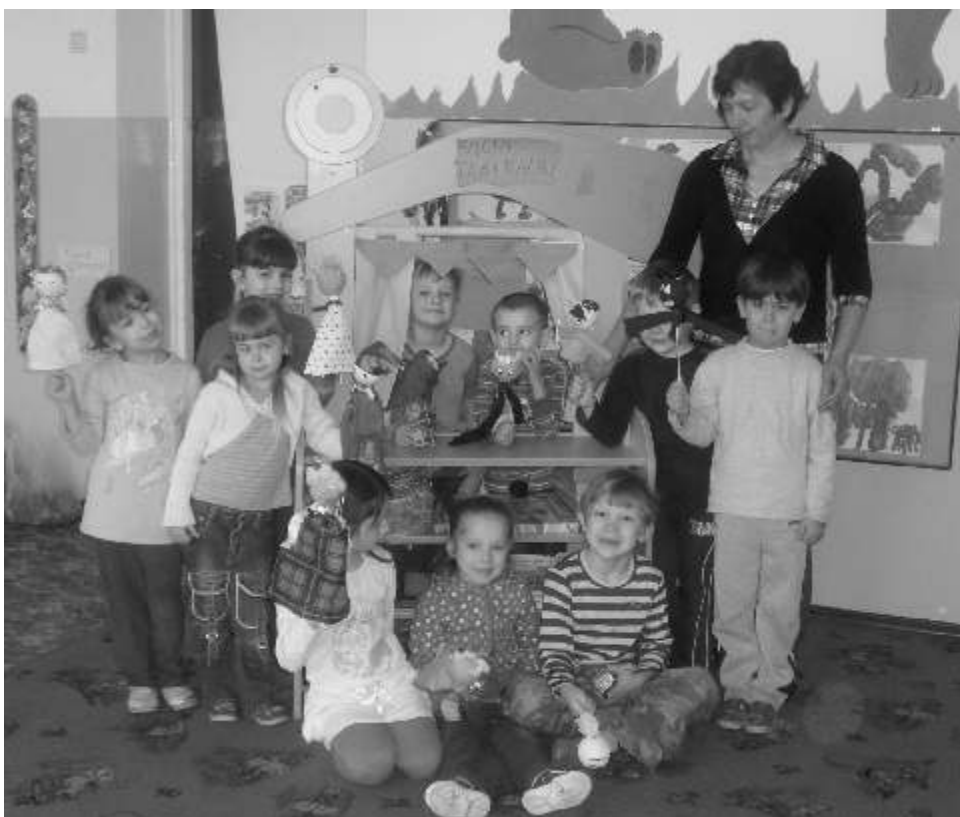
Mali aktorzy z dumą prezentują własnoręcznie wykonane kukielki