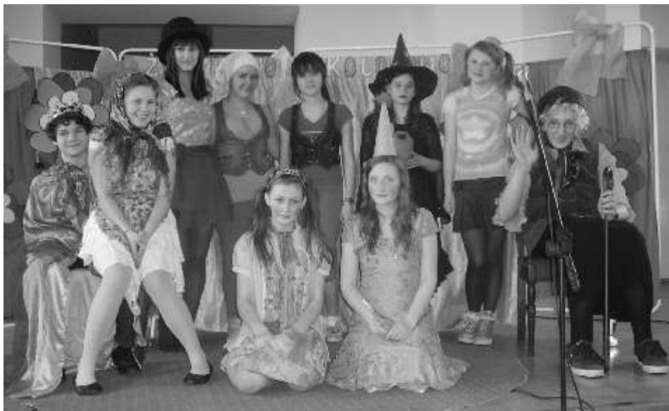
Członkowie koła teatralnego przed wyst pem