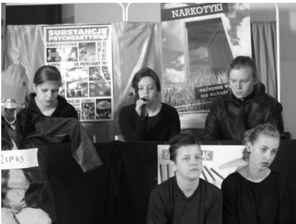
„Nie mam ju nic” w wykonaniu koła teatralnego „AK”