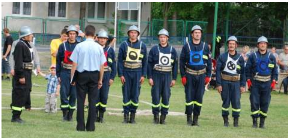
Zwycięska drużyna tu przed startem