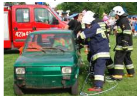
Stracy podczas pokazu