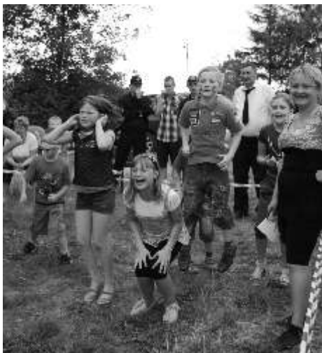
Dzieci wietnie si bawiły

Spotkanie urozmaiciła oprawa muzyczna, którą zapewnił wrocławski zespół „Estern”. Wesołej atmosferze towarzyszyła słoneczna pogoda, którą pozwoliliśmy na zabawę do godzin wieczornych.