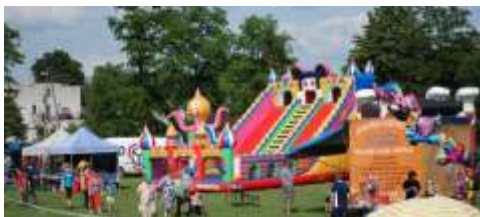
Jedna z głównych atrakcji dla dzieci