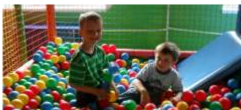
Dzieci wietnie się bawiły