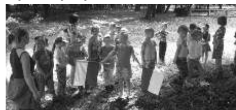
Wycieczka po parku

Potem maluchy na specjalnym torze przeszkód beztrudno z uśmiechem na twarzach pokonywały związane z nimi trudności. Wojsko wojskiem, ale przecież najwspanialszą jest dobra zabawa.