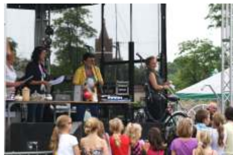
Konkurs z nagrodami