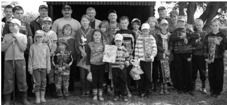
Wszyscy uczestnicy wraz z p. Wójtem oraz Zarządem