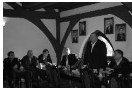
W trakcie obrad