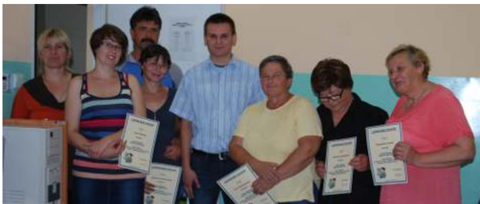
Uczestnicy kursu wraz z prowadz cym