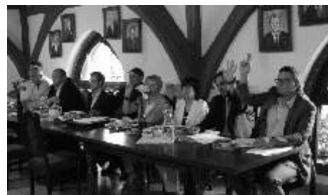
Głosowanie podczas sesji

Informacja o ogłoszeniu wykazu dostępna jest pod adresem www.bip.lisewo.com