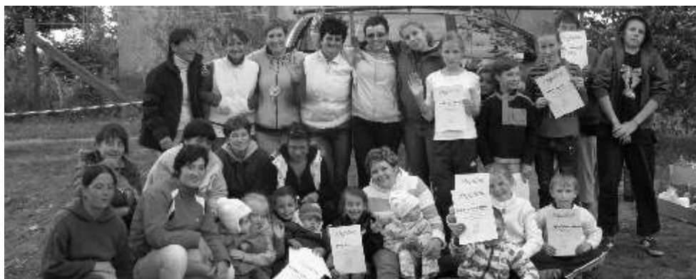
Grupowe zdjęcie uczestników Dnia Dziecka