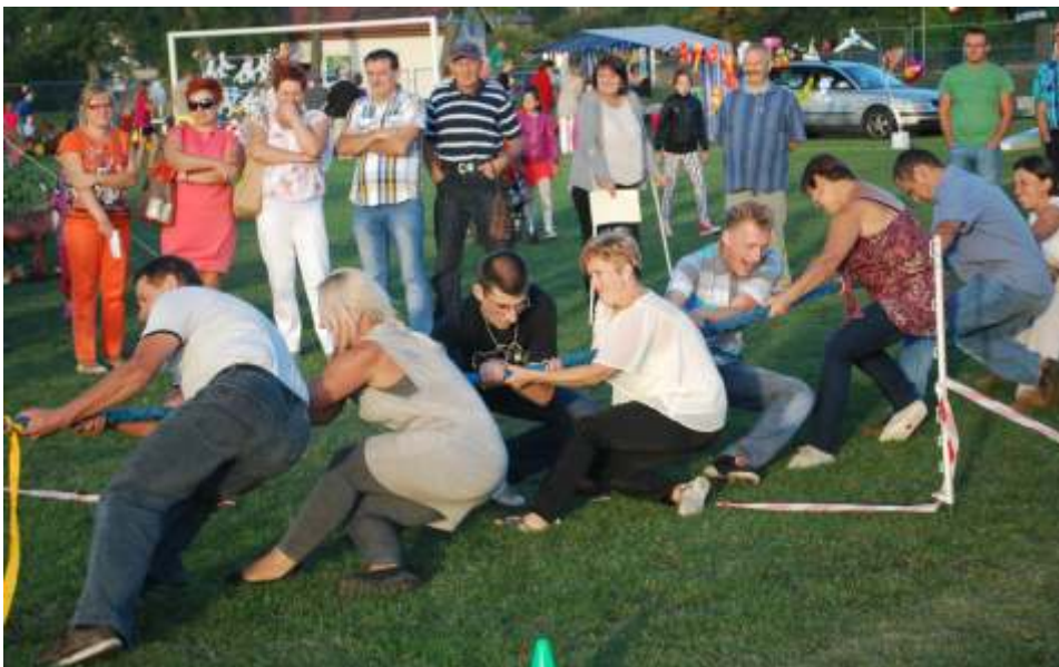
Jedną z konkurencji było przeciąganie liny

Tradycyjnie już, dla wszystkich zgromadzonych widzów, zarówno dorosłych, jak i dzieci, zostały przygotowane rozmaite atrakcje. Każdy mógł spróbować pysznej grochówki, kiełbasek z grilla czy chleba z smalcem i ogórkiem.