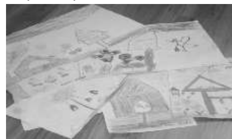
Prace wykonane przez dzieci

Jednym z wydarzeń w szkole, oprócz tradycyjnego żółtkobrania, nam powiodło się zorganizować konkurs. Miło poinformować, e w dniu 15 października br. Starostwo Powiatowe w Chełmnie rozstrzygnęło konkurs z cyklu „Sołectwo przyjazne środowisku” i wyłoniło laureatów tegorocznej edycji. Nagrodzona została również nasza wieś za projekt pt. „Ptasia stołówka - Nasza wizytówka” za co otrzymaliśmy czek na 1000 zł.