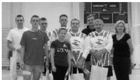
Drużyna Gminy Lisewo