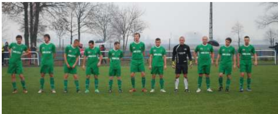
Skład Victorií podczas ostatniego meczu z Kasztelanem Papowo