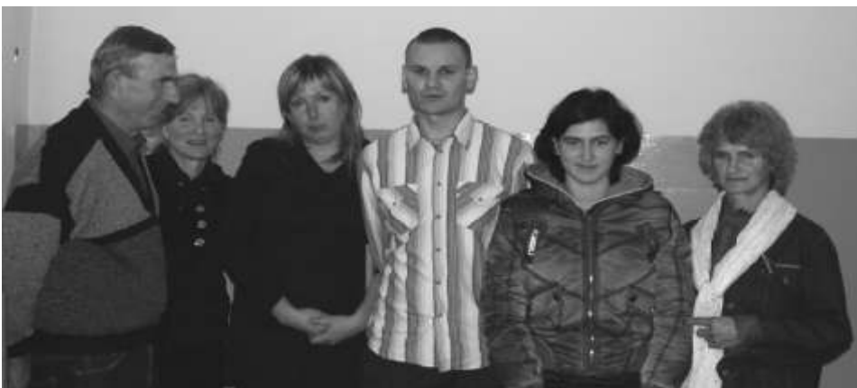
Kursanci wraz z wykładowcą