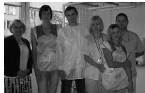
Trzyosobowa ekipa ukończyła kurs opiekuna osób starszych, chorych i niepełnosprawnych