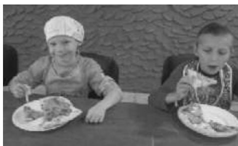
Później przyszła pora na kosztowanie