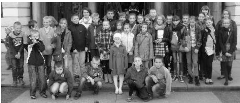
Wyjazd do teatru na długo zostanie w pamięci uczniów

Uczniowie poznali zasady udzielania pierwszej pomocy i przećwiczyli na fantomach zabiegi resuscytacyjne (czyli reanimację) dorosłych i dzieci. Dowiedzieli się, jak postąpić w przypadku różnego typu urazów, krwawie i zranie. Zakładali opatrunki na różnego typu rany. Unieruchamiali stawy w przypadku złamań, zwichnięć i skręceń. Zajęcia stały się okazją do integracji klas piątych. Wychowawczynie przygotowały słodki poczęstunek w postaci domowych wypieków.