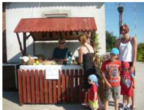
„Sklepik” równie przyci gał wielu ch tnych

Doro li mogli wykaza si umiej tno ciami w takich konkurencjach jak: wbijanie gwo dzia, czy przeci ganiu liny. Du o miechu i starte kolana na trawie to cena jak zapłacili najlepsi. Panie sprawdzały si w obieraniu ziemniaków w konkurencji przygotowanej przez stra aków - zakładanie odzie y bojowej NOMEX na czas. Onie mielone rozmiarem panie niech tnie zgłaszały si do tej zabawy, ale po wyja nieniu zasad ch tnych ju nie brakowało. Co najciekawsze konkurencja cieszyła si zainteresowaniem głównie w ród pa w dojrzałym wieku. Czy by w Strucfoniu szykowała si e ska dru yna OSP?