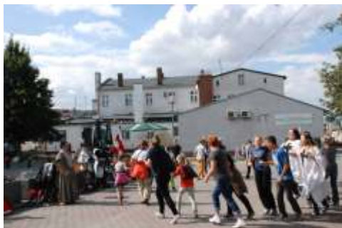
Jeden z wielu etapów rozgrywki