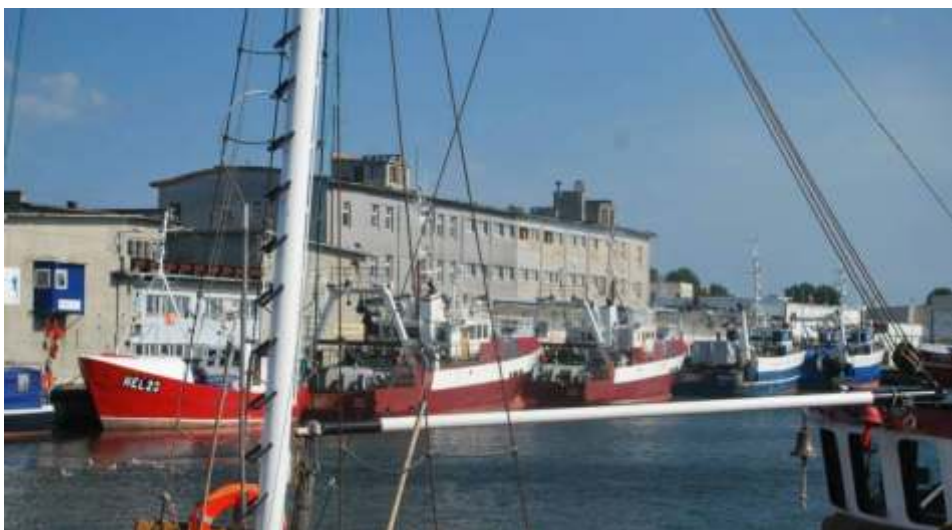
Hel i jego uroki

20 lipca 2014 roku przy sprzyjającej atmosferze pogodowej odbyła się kolejna wycieczka organizowana przez Gminne Centrum Informacji w Lisewie. Tym razem celem uczestników był półwysep helski, a konkretnie dwa miasta: Jastarnia i Hel. Wyjazd zaplanowany został na niedzielny poranek z przystanku autobusowego w Lisewie. Ze względu na bardzo duże zainteresowanie czekały na niego tylko dwa rodzaje transportu: autobus i autokar. Po kilku godzinach komfortowej podróży bez większych przestojów na drodze wszyscy dotarli do pierwszego punktu wycieczki, czyli Jastarni. Ta niewielka stosunkowo miejscowość słynie, zwłaszcza w okresie wakacyjnym, z przeprowadzanych kursów windsurfingowych a także kitesurfingowych. Taka atrakcja stanowi doskonale urozmaicenie odpoczynku na plaży zwłaszcza dla osób, które chcą aktywnie spędzić wolny czas przy dobrej zabawie. Choć pływanie na desce windsurfingowej może się na pierwszy rzutek wydać do prostego, kiedy stoi się z boku na plaży, to po osobach, które skorzystały z tej formy letniego relaksu widać było zmęczenie po godzinnej walcie z deską i aglem. Pogoda nad morzem dopisywała złapaniu opalenizny, to też nie było w tym nic dziwnego, że plaża w Jastarni