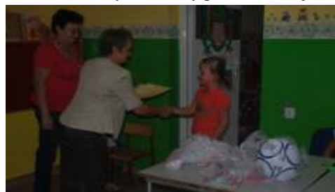
Wr czenie dyplomów oraz nagród