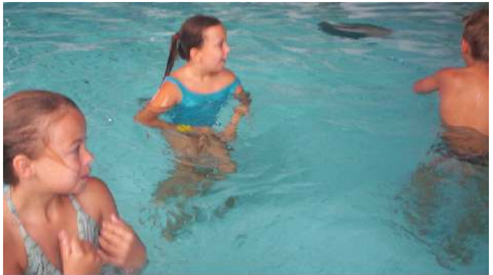
Dzieci nie ukrywały swojej radości