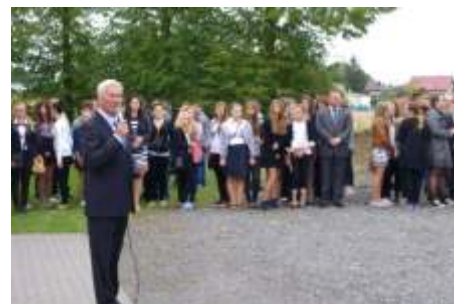
Uroczysty apel rozpoczynaj cy rok szkolny

1 wrze nia 2014 roku to niew tpliwie wa ny dzie w yciu Polaków, to ju 75. rocznica wybuchu II wojny wiatowej, która to została okupiona krwi naszych rodaków walcz cych o niepodległe pa stwo. Pami o nich uczniowie lisewskiego gimnazjum uczcili minut ciszy i zło eniem kwiatów na ich mogiłach. 1 wrze nia to równie data powrotu uczniów do szkolnych ławek po wakacyjnej przerwie, dlatego te Pan dyrektor gor co powitał zgromadzonych na placu szkolnym gimnazjalistów, rodziców i nauczycieli. yczył wszystkim owocnego i radosnego roku szkolnego, pełnego nauki, wyzwania oraz realizacji