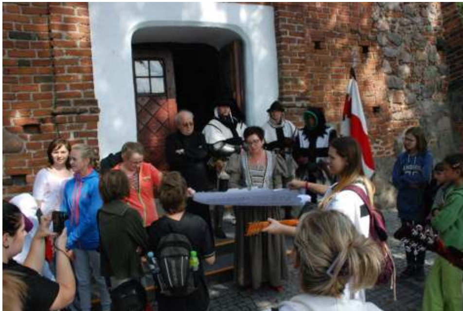
Szerokie grono uczestników zebrane pod bramą kościoła

Dnia 23 sierpnia 2014r. o godzinie 14:30 Stowarzyszenie Przyjaciół Gminy Lisewo wraz z uczestnikami rozpoczęło grę terenową pt.: „Podróż z Szlakiem Jaszczurczym, Ocal Mikołaja z Ryńska”. Celem gry było przede wszystkim zwiększenie aktywności oraz promowanie lokalnego dziedzictwa kulturowego i historycznego. Drużyny miały jak najszybciej i jak najdokładniej pokonać wyznaczoną trasę. Ta, która dotarła jako pierwsza i zdobyła najwięcej punktów przyczyniła się do zmiany biegu historii i ocaliła przed zaplanowanym cięciem Mikołaja z Ryńska przez Zakon Krzyżacki. Przed głównym wejściem do Kościoła p.w. Podwyższenia Krzyża w Lisewie, gdzie miały miejsce spotkania Towarzystwa Jaszczurczego, zebrało się ponad 40 chłopców. Po zbiorczej odczytano traktat gry terenowej, który informował między innymi o tym, iż w Lisewskim Kościele odbywały się zjazdy Rycerzy Ziemi Chełmińskiej, o których wiedział, w których uczestniczył oraz nad którymi nadzorował Komtur Krzyżacki z Lipienka. Najbardziej aktywnym wśród rycerzy był Mikołaj z Ryńska, który brał czynny udział