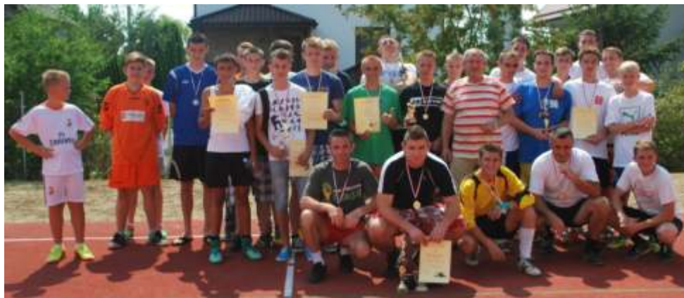
Pamiłkowe zdjęcie uczestników turnieju

W upalną sobotę 19 lipca, w bardzo korzystnej atmosferze na boisku wielofunkcyjnym przy Szkole Podstawowej w Lisewie odbył się Wakacyjny Turniej Piłki Nożnej.