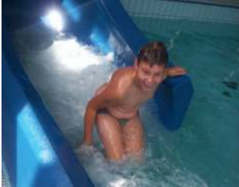
Zjeżdżalnia - jedna z wielu atrakcji

Ciekawą formą aktywnego spędzenia wakacyjnego czasu zorganizowała Gmina Lisewo we współpracy z sołtysami naszych wsi.