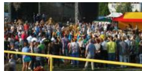
Tłumy zebrały si by podziwiania wyst p ma oretek

piosenkarki. Na samym ko cu przenie li my si w rytmy disco polo, poniewa na scen wkroczył „Skaner”.