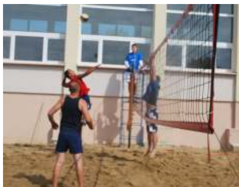
Siatkarze w trakcie zaciętej walki

W sobotę, 16 sierpnia 2014 roku, odbył się Turniej Siatkówki Piłkowej, który dostarczył nam wiele pozytywnych emocji. Mimo niesprzyjającej pogody drużyny biorące udział w zawodach pokazały jak znakomicie się bawić i spędzić sobotę na sportowo! Do walki o zwycięski tytuł stanęło 7 drużyn, które podzielone zostały na dwie grupy.