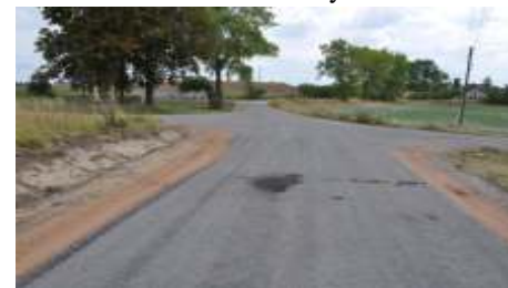
Wyremontowany odcinek drogi A.J

Tak e w Malankowie do u ytku publicznego został oddany odcinek drogi po gruntownej renowacji, którego długo wynosi 500 mb, za ogół prac obj ł powierzchni o ł cznym rozmiarze 1847,5 m 2 . Przetarg na ow inwestycj wygrało Przedsi biorstwo Robót Drogowo Budowlanych Sp.j. maj ca swoj siedzib w Chełm y. Ł czny koszt inwestycji to 165.431,83 zł i został on pokryty z bud etu Gminy Lisewo .