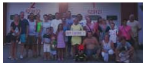
Grupowe zdj cie na koniec wycieczki