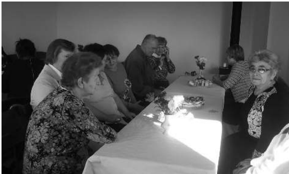
Na zakończenie wszyscy zebrani zasiedli do wspólnego stołu