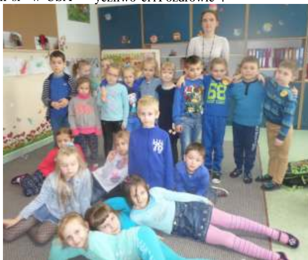
Grupa maluchów z wychowawc