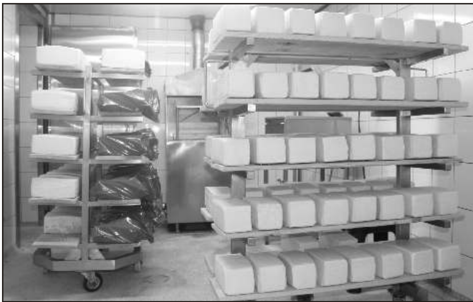
Proces dojrzewania serów

W Spółdzielni Mleczarskiej w Lisewie cały czas podejmuje się i realizuje liczne działania zmierzające do jej rozwoju. Jednym z przykładów jest uruchomienie sprzedaży w przyzakładowym sklepiku, w którym oprócz własnych wyrobów sprzedawane są również artykuły nabiałowe.