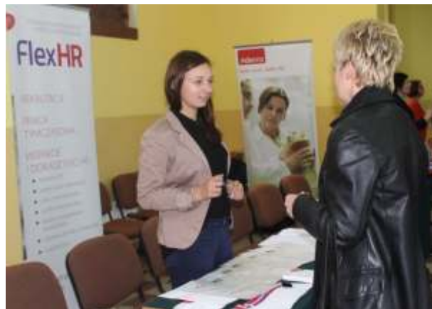
Na I Lisewskie Targi Pracy przyszło dużo zainteresowanych

pracy. Organizując Targi Pracy Urząd Gminy oferuje możliwość komunikacji z potencjalnymi pracownikami firm, które poszukują osób do pracy. Osoby zainteresowane podjęciem pracy, mogły rozmawiać z przedstawicielami firm i przedsięwzięć, lepiej poznać ich kulturę organizacyjną, profil, wymagania i oczywiście wysłać aplikacje na wybrane oferty. Udział w Targach Pracy był całkowicie bezpłatny. Organizowane Targi Pracy cieszyły się dużym zainteresowaniem w ród