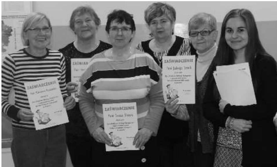
Na zakończenie wszystkie kursantki otrzymały za wiadczenie potwierdzające ukończenie kursu