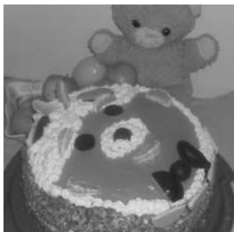
Dzieci mogły skosztowa domowy tort - Pluszowy Mi

w ubiegłym roku, piekli my gofry - za w tym gospodarz spotkania - Pluszowy Mi - zaprosił dzieci na domowy tort i ptasie mleczko. Tradycji stało si zado po oficjalnym powitaniu go ci - wzruszony mi zaprosił wszystkich do delektowania si ciastem i napojami.