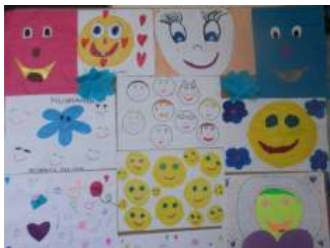
Wszystkie prace dzieci były starannie wykonane