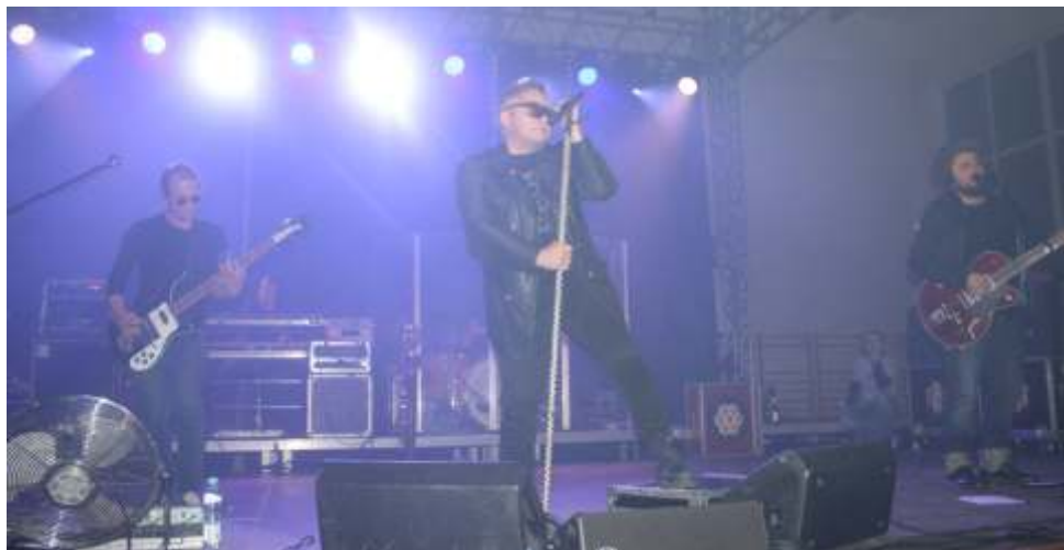
Na zakończenie festiwalu zaprezentowała się gwiazda wieczoru zespół T - Love