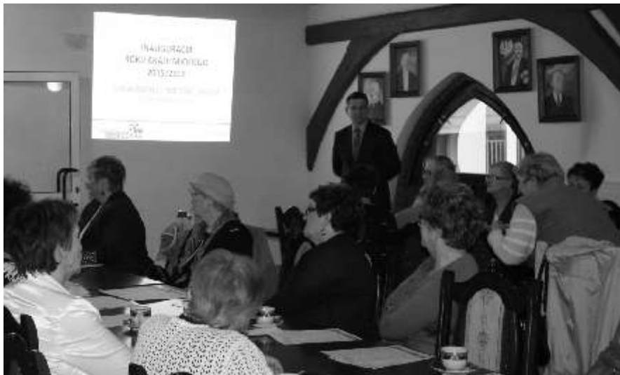
Wszyscy zebrani uważnie słuchali wykładu