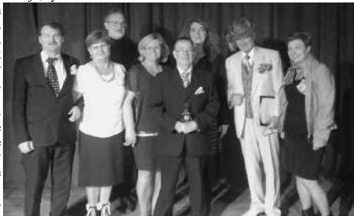
Zespół "Lisewianie" w pełnym składzie