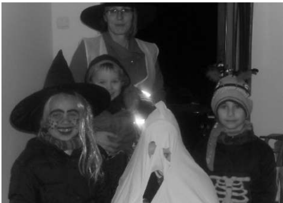
Dobre duszki w swoich przebraniach odwiedzały domy