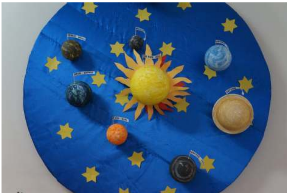
W ramach lekcji twórczo ci dzieci wykonały układ słoneczny