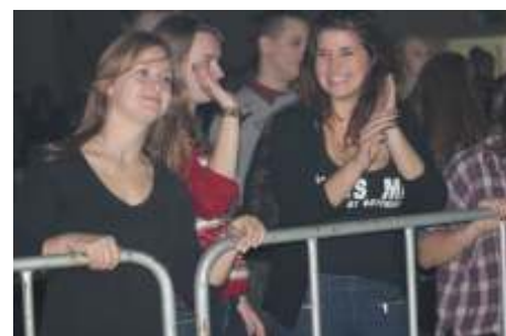
Publiczność wietnie bawiła się podczas koncertu