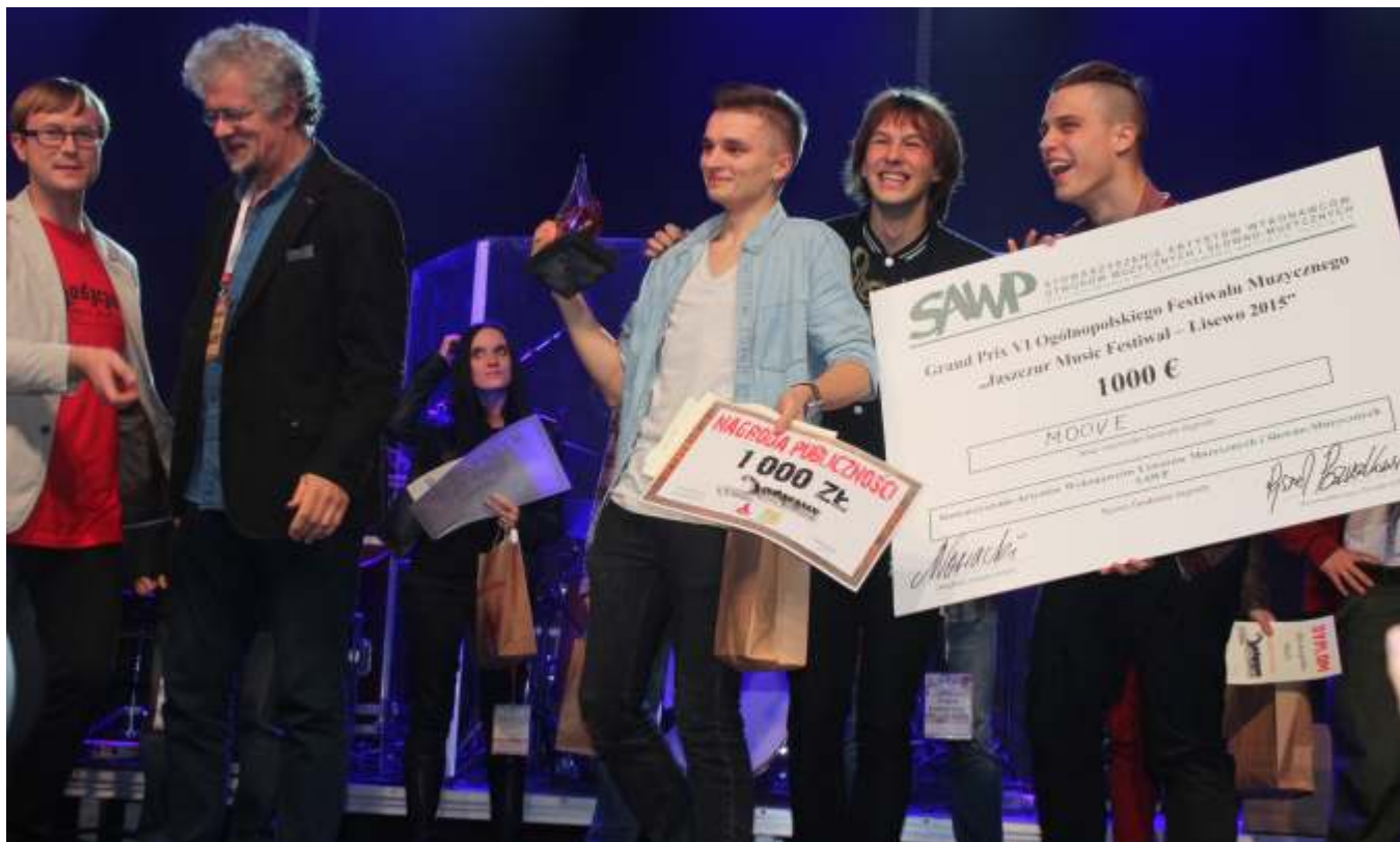
Zespół "Moove" z Torunia nie ukrywał swojej ogromnej radości ze zwycięstwa

17 października odbyła się VI edycja Ogólnopolskiego Festiwalu Muzycznego „Jaszczur Music Festival - Lisewo 2015”.