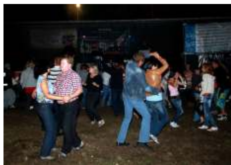
Zabawa taneczna przy zespole TRIO NIGHT z Torunia