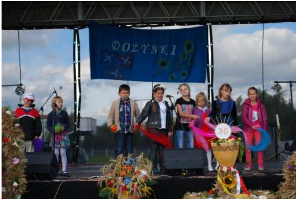
Występy dzieci ze wiośnicy rodowiskowej w Lisewie