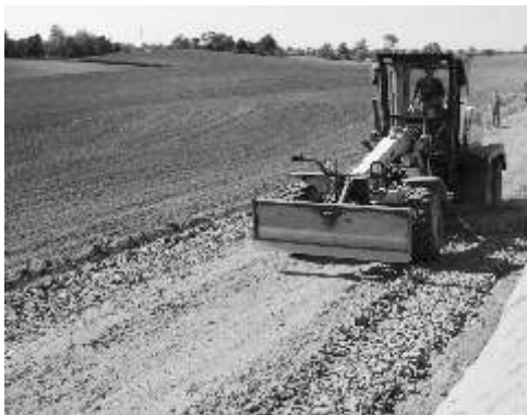
Ciarki sprzątane podczas prac drogowych