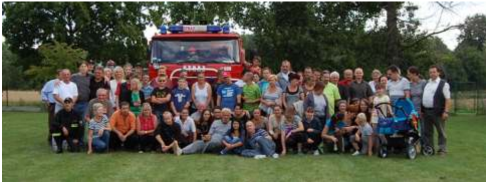
Wspólne zdj cie wszystkich zgromadzonych uczestników