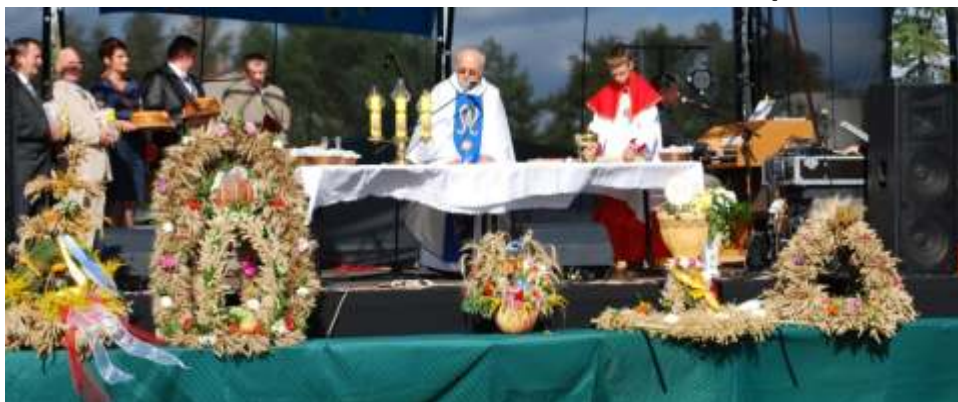
Msza wi ta odbyła si na stadionie sportowym w Lisewie