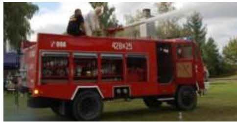
Wóz stracki - jedna z atrakcji pikniku