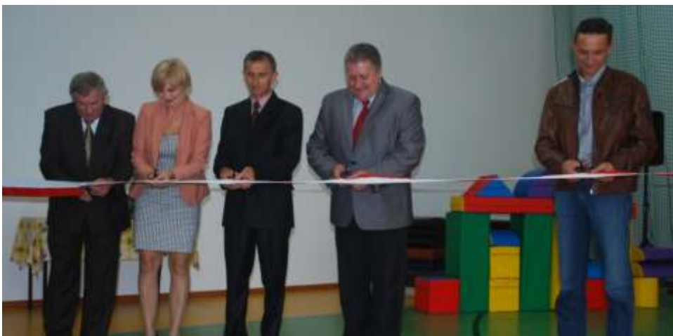
Symboliczne przecięcie wstęgi

13 wrze nia 2012 roku przy Szkole Podstawowej w Krusinie odbyło si uroczyste otwarcie nowo wybudowanej hali sportowej. Inwestycja ta została zrealizowana dzi ki wsparciu z funduszy Samorz du Województwa. Ceremonia rozpocz ła si od wyst pienia Wójta Gminy