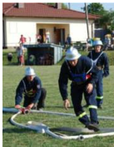
Stracy podczas zmagania