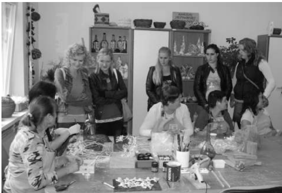
Studentki podczas rozmowy z pracownikami

Podczas swojego pobytu odwiedzili oni Zakład Aktywności Zawodowej w Drzonowie oraz inne instytucje z powiatu chełmskiego, które pracują z osobami niepełnosprawnymi (tj. DPS Mgoszcz, DPS w Chełmnie, Specjalny Ośrodek Szkolno-Wychowawczy w Chełmnie). Uczestniczyli również w festynie wycieczki Posągów oraz w Pikniku Integracyjnym w Robakowie. Studentki były pod wrażeniem funkcjonowania ZAZu, który jest nowoczesnym obiektem, dobrze zagospodarowanym i wyposażonym. Podkreśliły, że Zakład stwarza niepełnosprawnym idealne miejsce do pracy, co potwierdzają szczere twarze pracowników. Opowiedziały jak u nich wygląda współpraca oraz opieka nad niepełnosprawnymi. Ciekawostką jest to, że w Holandii tego typu instytucje nie są