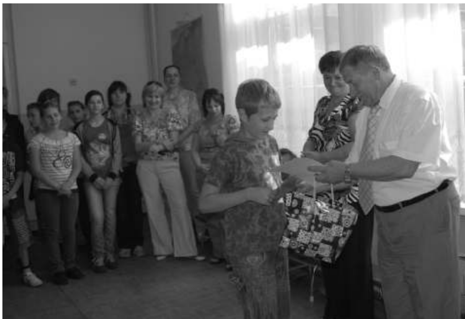
Jeden ze zwycięzców odbiera nagrodę z r. k. p. Wójta