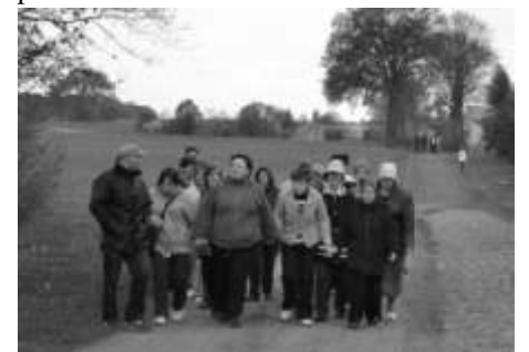
Uczestnicy w trakcie pielgrzymki

W trakcie przedłużonego majowego weekendu, a konkretnie 2 maja, dwudziestoosobowa grupa mieszkańców Domu Pomocy Społecznej w Mgoszczu wyruszyła pieszo pielgrzymką do figurki świętego Józefa w Józefkowie. Od kilku lat mieszkańcy placówki regularnie uczestniczą wraz z mieszkańcami tamtejszej wsi w Mszy w tej odprawianej przy figurce patrona pracy. Tym razem, ze względu na niepewną pogodę odbyła się ona w remizie strażackiej jednostki OSP w Józefkowie. Po nabożeństwie odprawionym przez ks. Proboszcza z parafii w Małgorzacie w Płunicy wszyscy przybyli do figurki świętego Józefa i wzięli udział we wspólnej majówce. Pomimo niesprzyjającej pogody pielgrzymi w doskonałych nastrojach, grzejąc się przy ciepłym ognisku zjadali pieczone kielbaski.