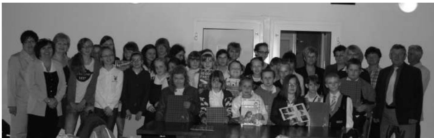
Zadowoleni uczniowie z dumą prezentowali swoje nagrody