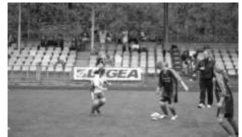
Zmagania w jednym z meczów