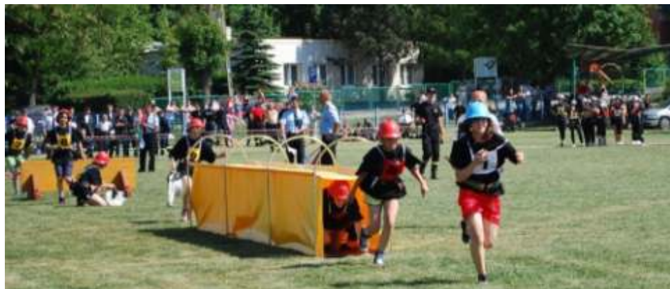
Uczestniczki zespołów młdzie owych w akcji