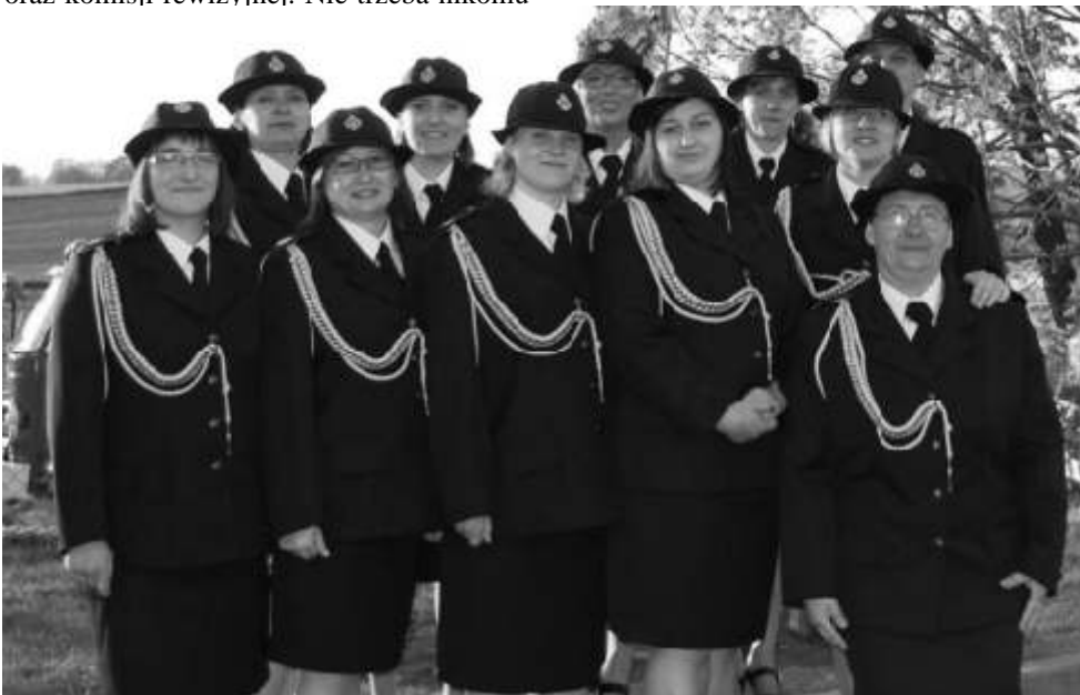
Pełen skład naszej kobiecej drużyny