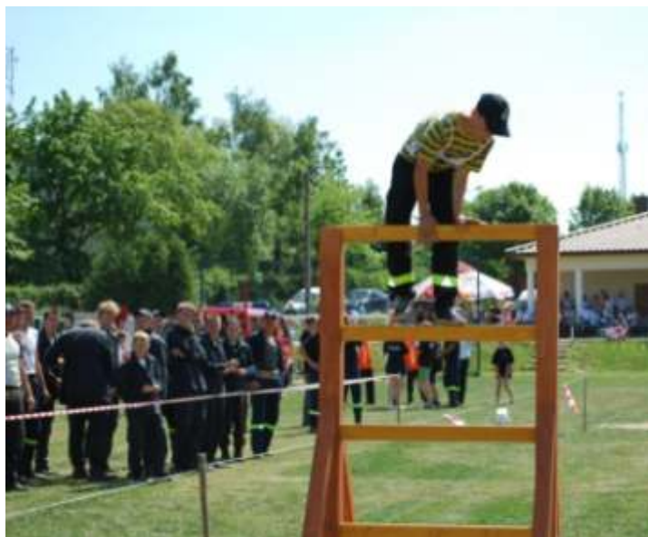
Jedna z najtrudniejszych przeszkód do pokonania...