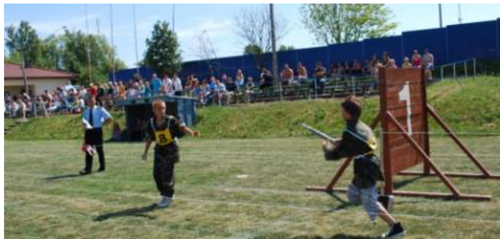
Chłopcy OSP Lisewo na torze przeszkód