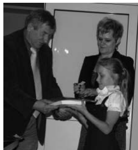
Dla najlepszych czekały upominki