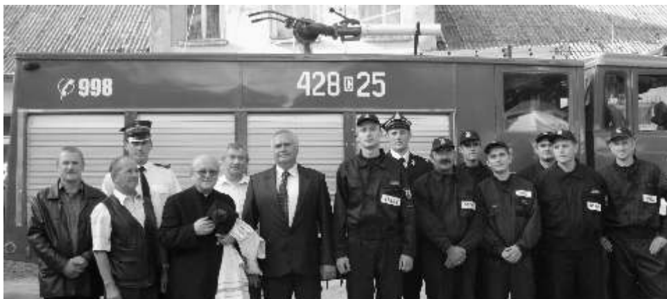
OSP Lipienko wraz z gośćmi