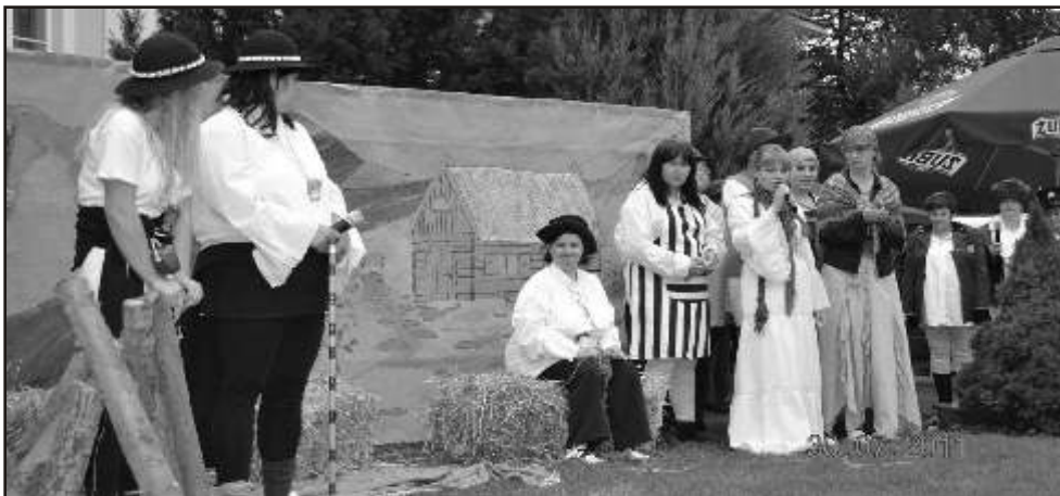
Występ zespołu Stokrotki podczas pikniku - „Janosik jeszcze bardziej prawdziwa legenda”