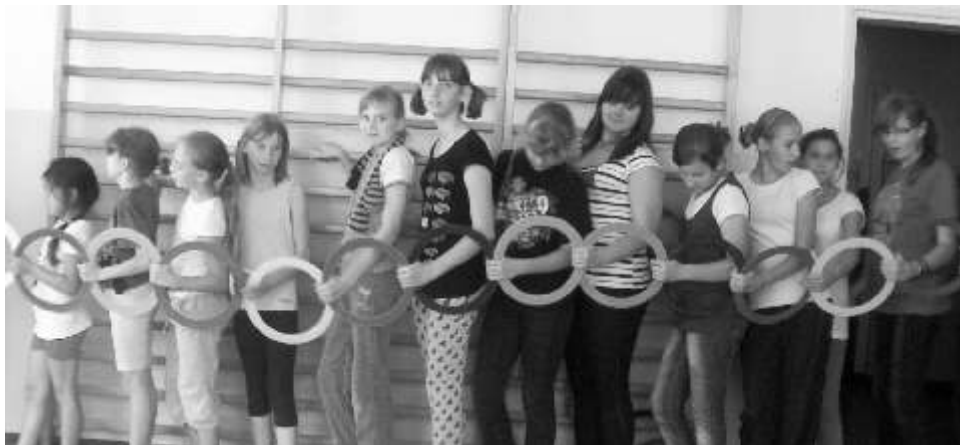
Kolorowy poci g