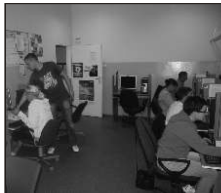
Kurs ABC Komputera

Beneficjentami wszystkich szkoleń są osoby zagrożone wykluczeniem społecznym pozostające bez zatrudnienia w wieku aktywności zawodowej.