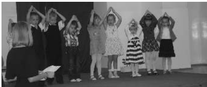
Jedna z grup przedszkolaków